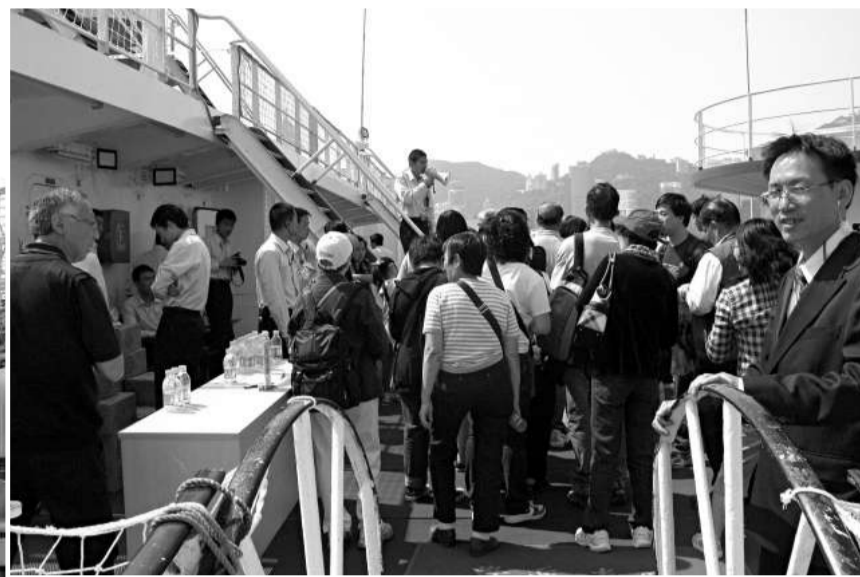
▲講解員向市民介紹遠望六號講解船上設備