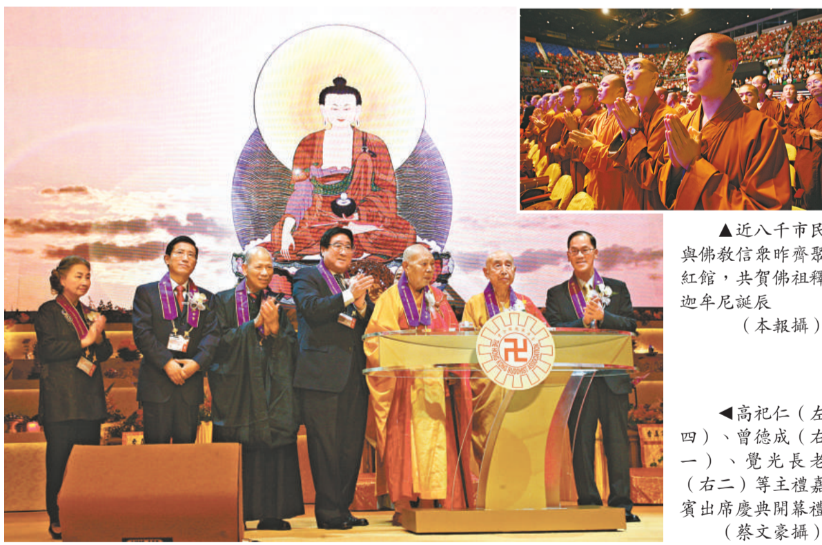
▲近八千市民與佛教信眾昨齊聚紅館，共賀佛祖釋迦牟尼誕辰

由五月一日起一連三日的慶祝佛誕活動設七場場內活動，共派出超過五萬張門票。主辦方還特別在紅館外廣場設置浴佛亭，並全日自由開放予信眾浴佛，預計三日內將有逾十萬市民參與。