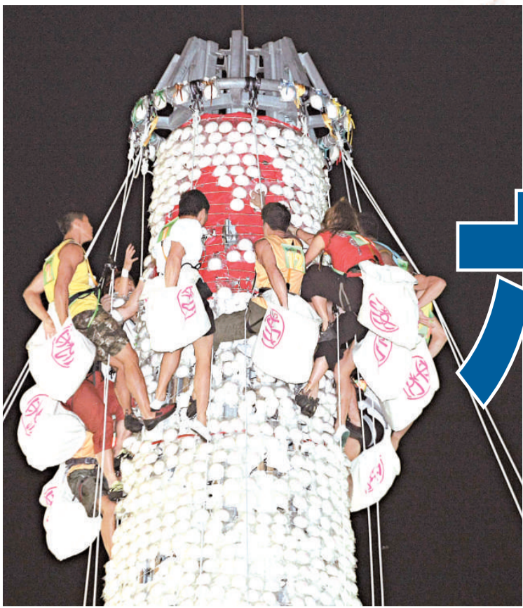
搶包山比賽今日凌晨零時展開，氣氛緊張刺激