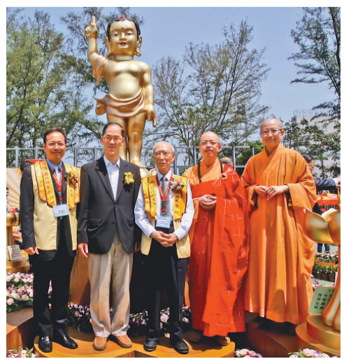
曾德成(左二)出席在香港維多利亞公園舉行的「佛誕嘉年華」 (本報攝)

【本報訊】由國際佛光會香港協會及佛香講堂主辦、一年一度的「佛誕嘉年華」，於五月一日及二日在香港維多利亞公園舉行，一連兩日共吸引約十萬市民，無懼甲流，共沾法喜。二日上午舉行的「生耕致富佛誕嘉年華2009」開幕儀式，選得香港民政事務局長曾德成和台灣佛光山慧覺法師擔任主禮嘉賓。