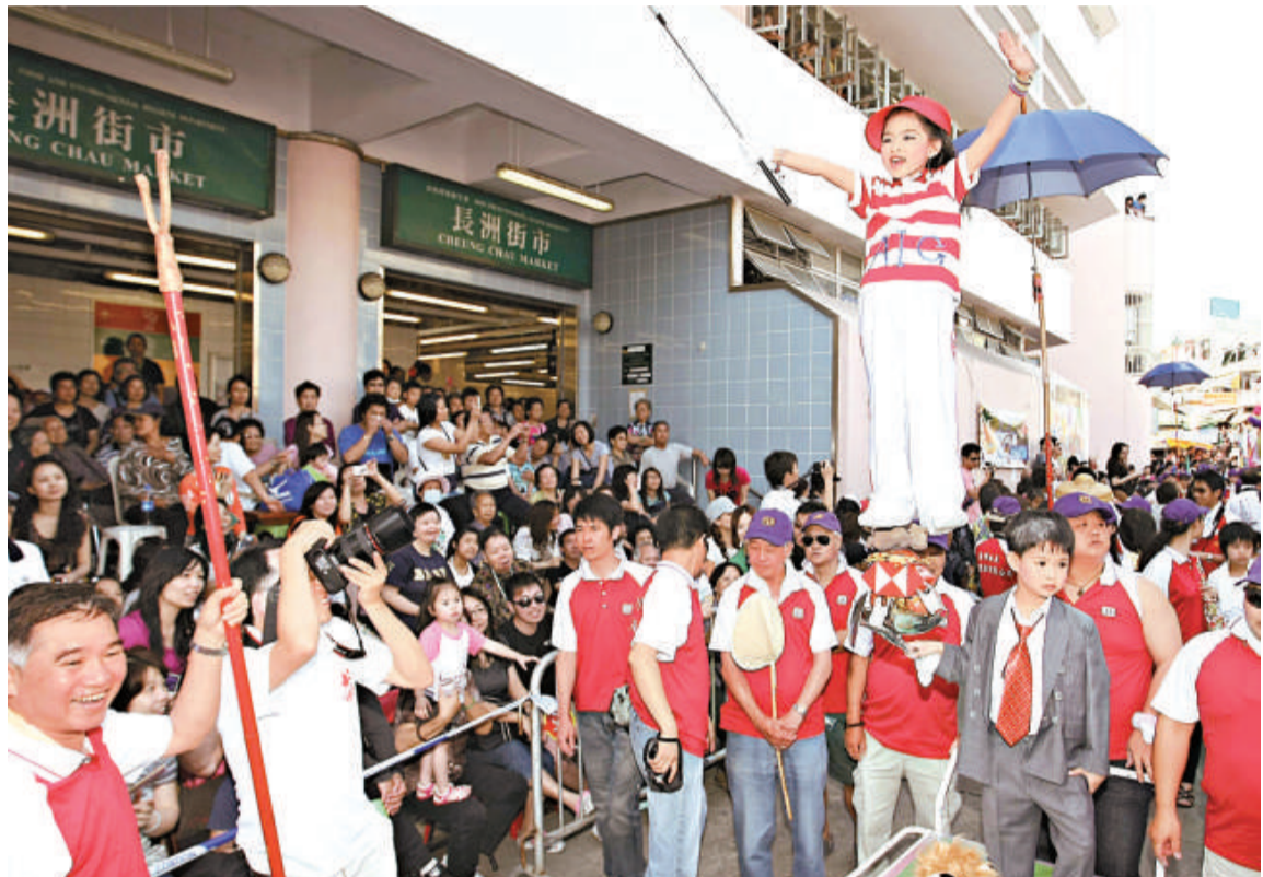
「累埋兄弟」飄色諷刺本港銀行銷售雷曼迷債，連累市民成為苦主

第一次到長洲參觀太平清醮的陳小姐表示，雖然到達長洲後即時戴上口罩，不過，並不擔心疫情會在港擴散。她說，飄色巡遊結束後，無意繼續觀看搶包山比賽。英國籍遊客 Sophia 則對疫情表示憂慮，稱