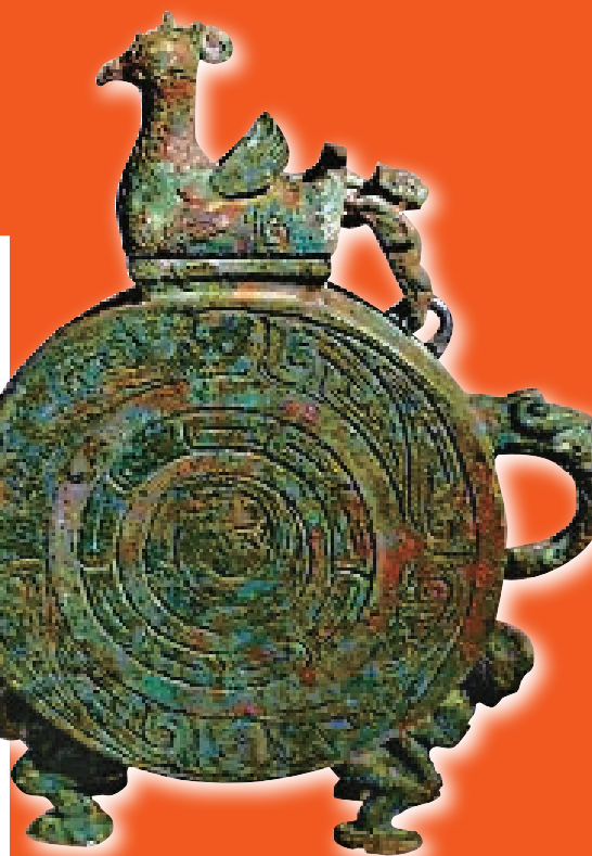
鳥蓋人足銅盃·（約公元前1046—前771年）