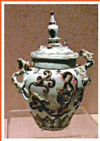
青花釉裡紅堆貼四靈塔蓋罐·元至元四年