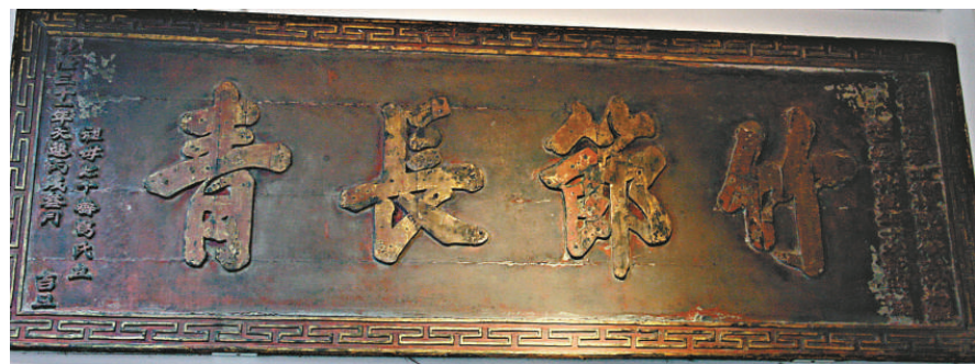
時任福建學政的紀曉嵐為祖母葛氏70大壽而題