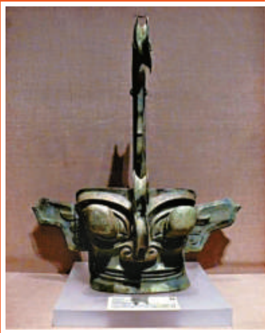
縱目銅人面 商代晚期