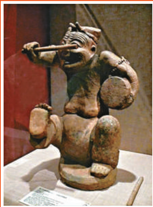
擊鼓說唱陶俑·東漢