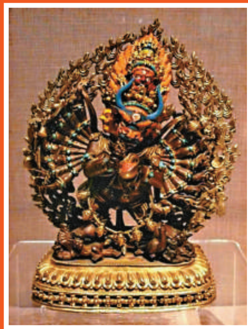
大威德怖畏金剛·清