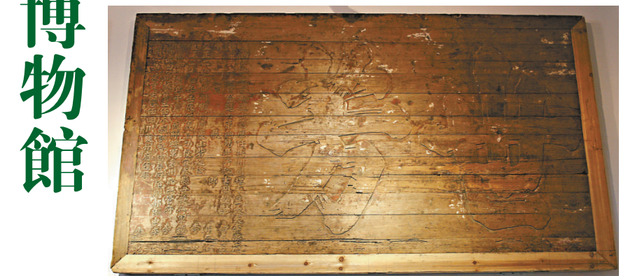
天順六年（公元一四六二年）懸掛宗祠家廟門上的匾額