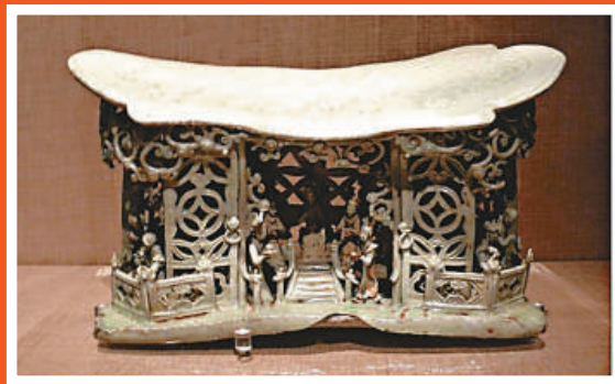
青白釉鏤雕戲台人物枕·元