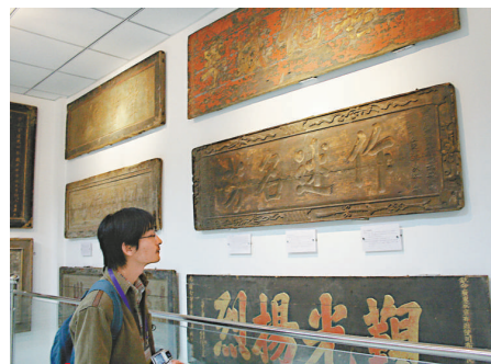
觀眾正在觀賞匾額

中國首座匾額專題博物館——洛陽匾額博物館，4月11日正式對外開放，展出近年來徵集的明代天順六年（公元1462年）至民國時期各類匾額500餘塊，其中不乏紀曉嵐、王傑、洪鈞、左宗棠、張之萬、于右任等名家作品。 匾額作為一種集書法、文學、雕刻藝術和裝飾美學於一體的傳統文化載體，被廣泛應用於社會生活的方方面面，因其用辭雅緻，書法精美，雕刻細緻，具有很高的藝術價值和歷史價值，歷來深受民衆喜愛。近年來，洛陽民俗博物館工作人員徵集到1700餘塊古匾，成為國內徵集古代匾額最多的博物館。