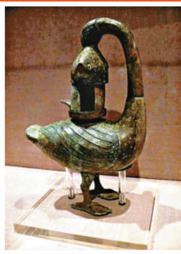
彩繪雁魚銅燈·西漢