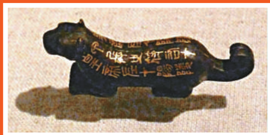
陽陵錯金銅虎符·秦