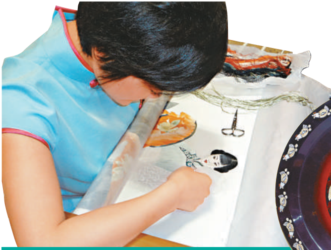
頗具地方特色的刺繡工藝在重慶市工藝美術展亮相

第二屆重慶市工藝美術展在重慶國際會展中心舉行，以「迎祖國六十華誕，展重慶工美精品」為主題。漆器、刺繡、陶器、石雕、木雕等頗具重慶地方特色且技藝精湛的工藝美術品種繁多，琳琅滿目。此次展會由重慶市經信委主辦，展場共二千四百平方米，有七十一家工藝美術企業參展，設置標準展位一百一十五個，是建國以來重慶市規模最大的工藝美術展。