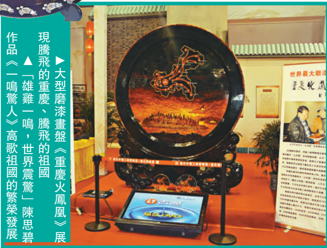
作品《一鳴驚人》、高歌祖國的繁榮發展

作者採用含蓄而高雅設計理念，在作品中心，蛋殼鑲嵌的雄雞正引頸高歌慶祝祖國的成就，盤邊以母雞下蛋寓意祖國各行業取得的巨大成果，凸顯中國人民團結一心，奮鬥拚搏，展現出一片欣欣向榮、蓬勃發展的大好形勢。鑲嵌彩蛋殼的技法，是陳思碧獲世界獎及國家級珍寶收藏的作品所採用的。