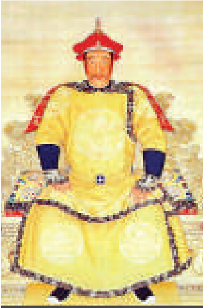
清太祖努爾哈赤戎馬一生，為清王朝建立打下基礎，並開創了對後世頗具影響的八旗制度

女真各部統一後，力量逐漸強大。努爾哈赤命人以蒙古文字結合女真語音創製滿文；他還在原有女真狩獵的「牛錄」組織的基礎上，建立起八旗制度，使整個女真部落成爲兵民合一的社會組織。1616年，努爾哈赤在赫圖阿拉稱汗，定國號爲金，歷史上稱爲後金。1618年，他發出「七大恨」的誓詞，發誓要爲父報仇，開始了覆滅明朝的進程。在攻打明朝邊關的過程中，努爾哈赤屢戰屢勝，獲得遼寧、瀋陽一帶的廣大地區，力量愈來愈強，奠定了清朝政權的基礎。