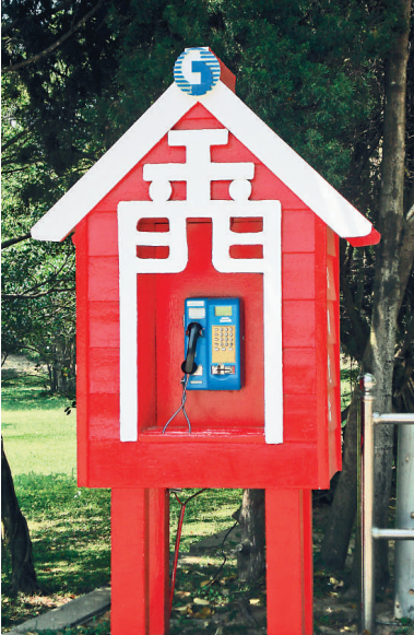
金門之名源自明太祖時譽島上城池「固若金湯，雄鎮海門」。圖為金門島上的電話亭

金門本稱渚洲，明太祖時爲防倭寇，在島上建城築池，譽爲「固若金湯，雄鎮海門」，乃成金門之名。金門本屬福建省思明縣（今廈