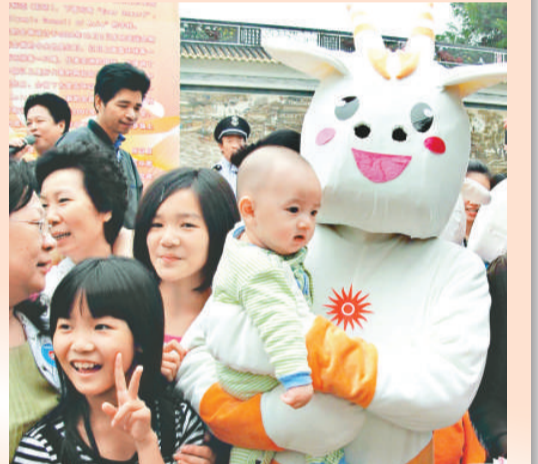
亞運會吉祥物與遊客同樂

【本報記者袁秀賢廣州報導】第十六屆亞運會將於明年十一月在廣州舉行，廣州寶墨園近日舉行了亞運會吉祥物與遊客同樂活動，節目有粵曲演唱、廣東音樂演奏表演等。此外，時尚、動感、可愛的亞運會吉祥物「五羊」(阿祥、阿和、阿如、阿意、樂羊)在園內熱情歡迎遊客們的到來，讓遊人感受到亞運會即將來臨的氣氛。沙灣是廣東音樂的發源地，何氏三傑——何柳堂、何與年、何少霞是廣東著名的作曲家，他們的名作，由藝人在園內傳唱。