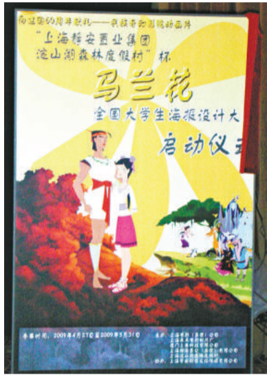
由大學生設計的海報在全國高校張貼

上海美影廠希望在此片上映的時候，造就「大手牽小手」的場面，即曾經看《馬蘭花》長大的祖父母、父母帶着自己的孩子們走進影院重溫兒時經典。