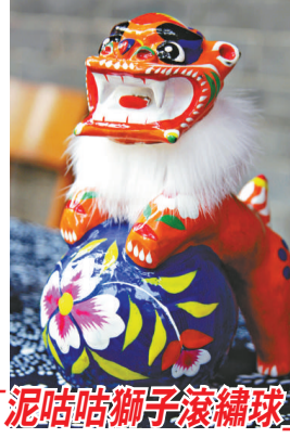
「泥咕咕獅子滾繡球」