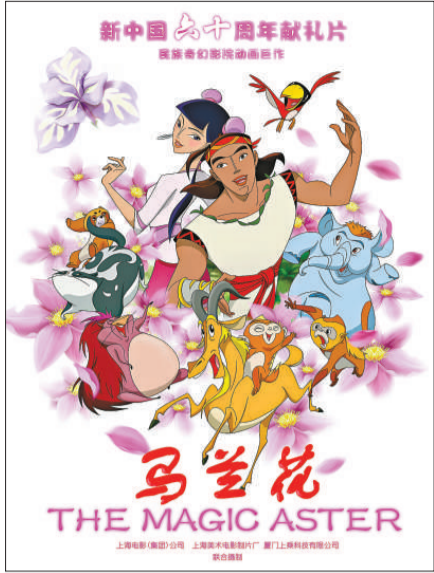
新版動畫電影《馬蘭花》的首款海報

【本報訊】記者張帆上海報導：被譽為中國動畫電影夢工廠的上海美術電影製片廠今年將再推新動畫電影大片。這部改編自經典兒童劇《馬蘭花》的動畫影片將在六月下旬上映，並已確定為建國六十年獻禮的重點動畫片。上海美影廠還啓動了大學生國產動畫影片《馬蘭花》海報設計大賽。