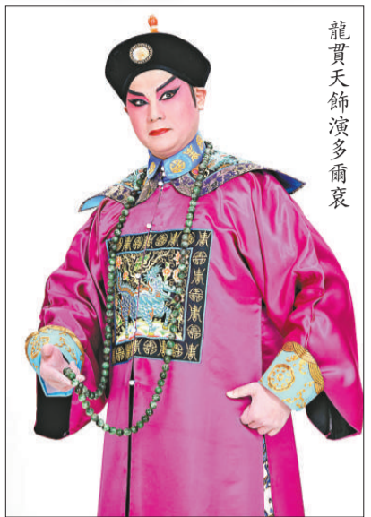
龍貫天飾演多爾袞

(星期二及三)晚上七時三十分於高山劇場劇院；及六月十八日(星期四)晚上七時三十分於荃灣大會堂演奏廳舉行。門票在各城市電腦售票處有售。節目查詢可電二六八七三二五，亦可瀏覽網頁 www.lcsd.gov.hk/cp。