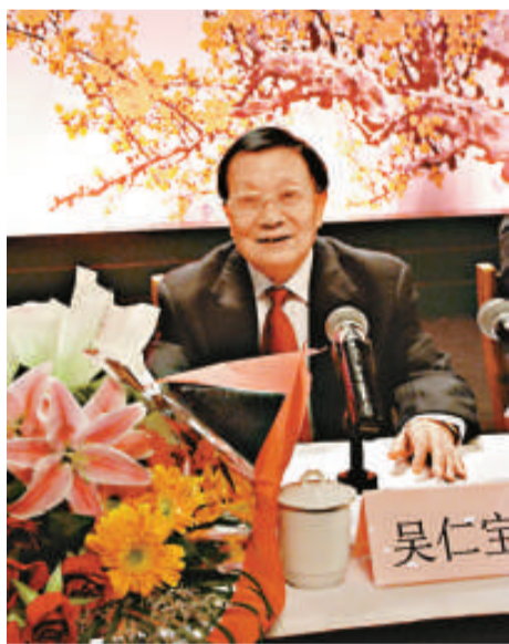
82歲的吳仁寶首次公開剖析60年功過

5日上午，在江蘇省無錫市華西村召開的誠信節座談會上，出席者有原人大常務委員會副委員長、原全國婦聯主席顧秀蓮