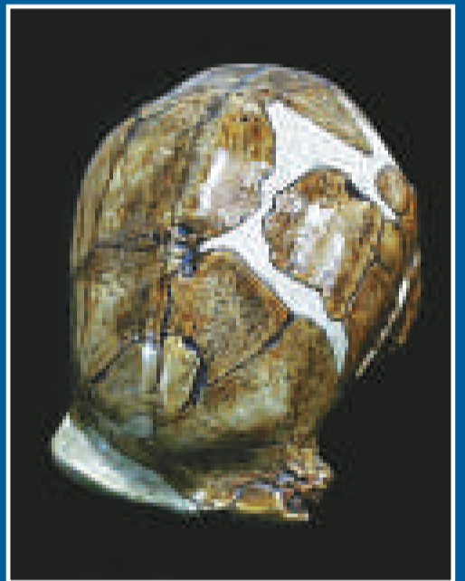
周口店出土的猿人頭骨模型

周口店遺址位於北京城西南約50公里處，是世界聞名的古人類遺址之一，1987年12月被聯合國教科文組織列入世界文化遺產名錄。迄今爲止，周口店遺址已發現了27處古人類、古文化和古脊椎動物的化石地點，其中包括80年前（即1929年）發掘出土震驚中外的「北京人」頭蓋骨化石。