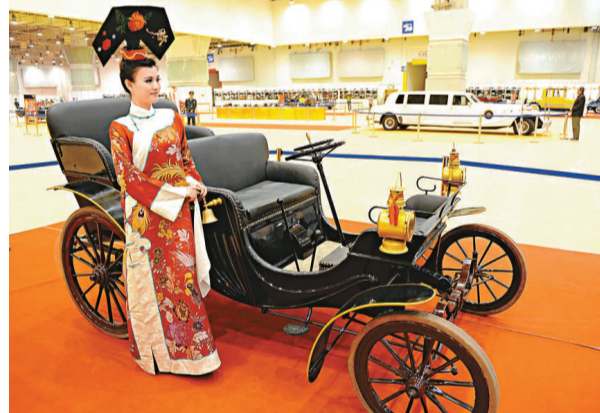
「老爺車展」飽眼福 在青島國際會展中心舉行的「老爺車嘉年華」展覽會上，34輛各國經典老爺車讓車迷和收藏愛好者大飽眼福。「老爺車展」還舉行了名人典藏老爺車評選、萬國極品車模展、汽車百年文化博覽等活動。圖爲一名身穿古裝的模特兒4日展示慈禧太后坐過的老爺車。(新華社)

調查得知，遼寧明長城分爲遼東鎮長城和蘄鎮長城兩個部分。其中，遼東鎮長城作爲明代「九鎮」長城的重要組成部分，東起丹東虎山，西至綏中雞子山，從東向西行經12個市的32個縣(市、區)，總長度爲1200餘千米，現存牆體長度700餘千米，消失牆體長度近500千米。據悉，蘄鎮長城南起綏中縣李家鄉新堡子村新台子屯，北至綏中縣加碑岩鄉舊關村，總長度10餘千米。(中通社)