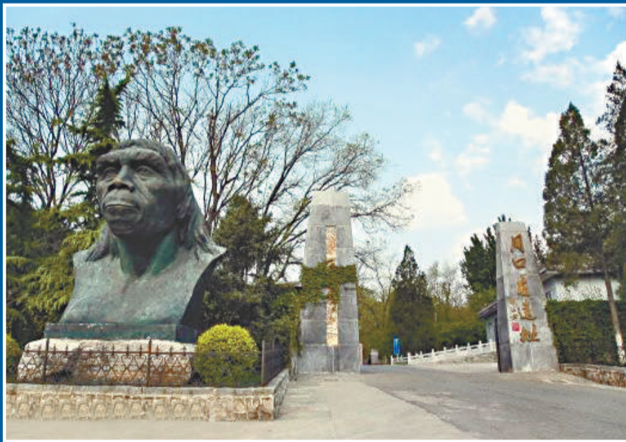
北京猿人第一頭蓋骨發現處的周口店遺址 (網絡圖片)