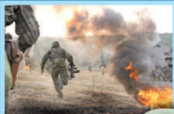
▲陸軍摩托化步兵師進行山地進攻戰鬥演習 (資料圖片)