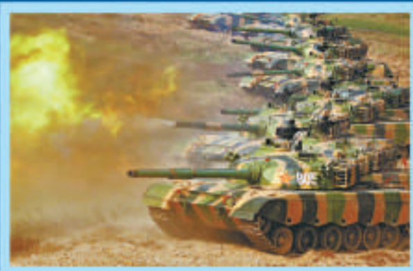
▲坦克部隊對敵前哨陣地進行火力打擊 (資料圖片)