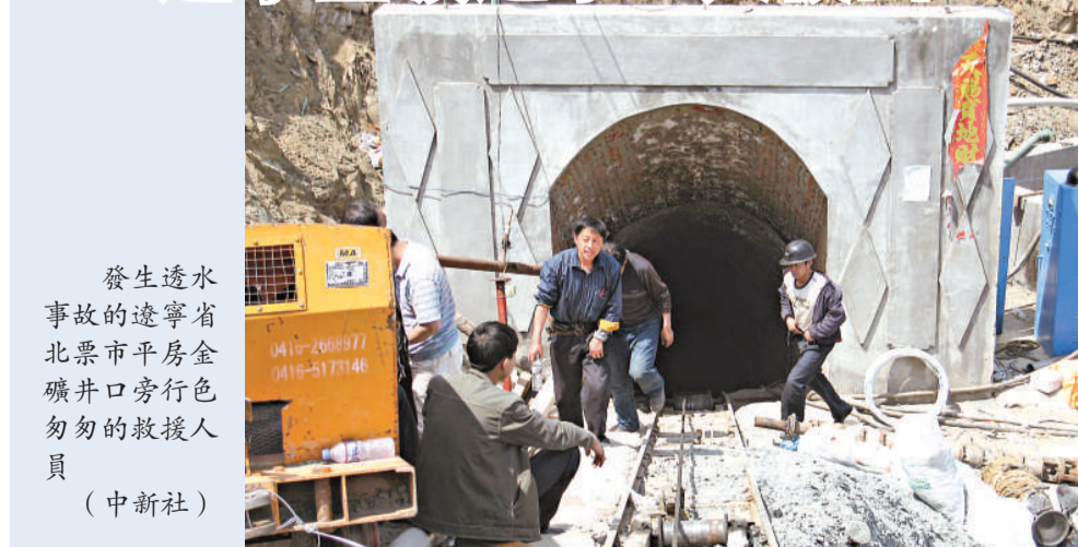
發生透水事故的遼寧省北票市平房金礦井口旁行色匆匆的救援人員

【本報訊】遼寧省北票市平房金礦4日發生透水事故，截至5日16時，救援仍在緊張有序進行。被困井下的5名作業人員都為當地村民，是該礦長期農民工，其目前情況不明。