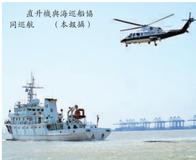
直升機與海巡船協同巡邏

今日參加巡邏的B-7310機機長說，該機型號為S-76C+，由美國西斯科斯基公司生產，配有絞車、氧氣瓶等專業救助設施，除機組外最多可搭載12人。今年年底將有2架發動機加強版的S-76C++直升機入役。到2011年底，還將有1架歐洲直升機公司生產的EC225「超級美洲豹」中型直升機加入東海第一救助飛行隊，EC225最大起飛重量約11噸，可搭載約20人，具備優越的海上飛行能力和環境適應能力。