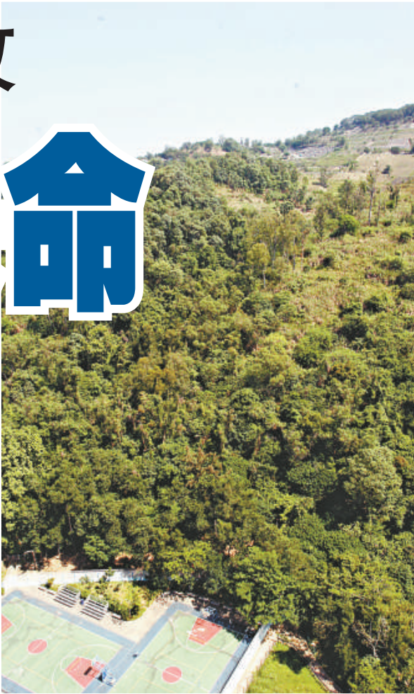
▲老翁被困叢林三日