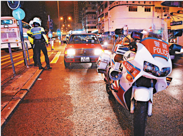
▶警員在意外現場調查

事發昨日凌晨四時許，一名年約二十餘歲打扮新潮的少女，在旺角亞答街，疑只顧講手提電話，沒有留意路面情況急急走出馬路，一輛的士沿上址駛往大角咀，司機見狀已急煞車，惟仍將她撞及，少女倒地手脚擦傷。的士司機即時落車查看事主傷勢及報案求助。傷者隨即由救護車送院治療。警方事後追查意外成因，初步不排除有人粗心大意惹禍。