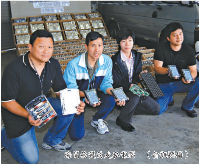
海關檢獲的走私電腦

【本報訊】記者俞凱穎報道：走私集團昨日凌晨在西貢西灣咀岸邊偷運電子零件，埋伏多時的水警人員上前截查，成功拘捕一名客貨車司機，在車尾廂檢獲一百二十箱貴價電腦硬盤、底板及晶片等貨物，總值五百一十八萬元，這是個半月內水警破獲的第六宗走私案。