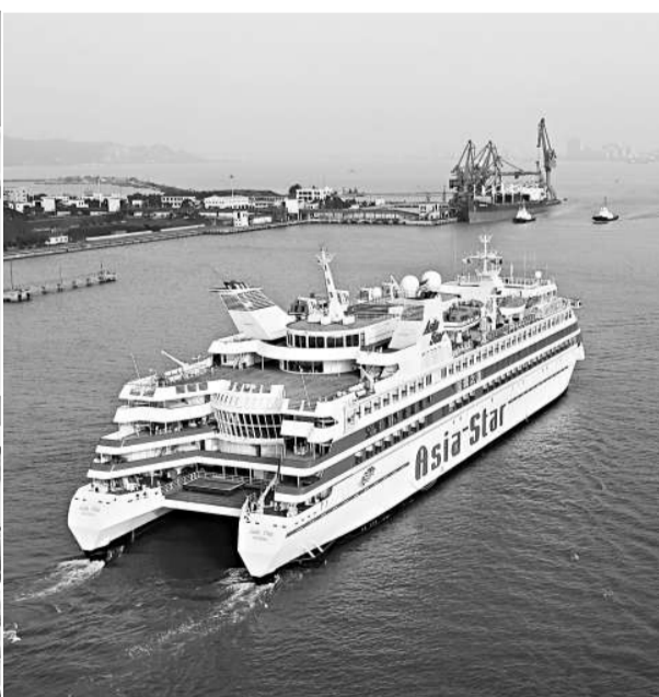
▲「亞洲之星」豪華郵輪昨日駛入汕頭港區，接載350名旅客登船前往台灣