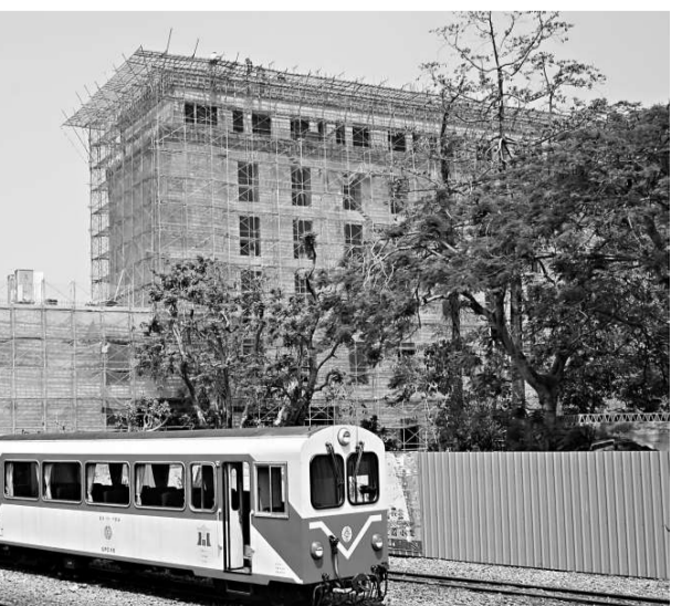
興建旅館 阿里山鐵路北門新火車站合併旅館興建工程，是阿里山「三合一」BOT案之一，自從政府開放大陸觀光客赴台後，阿里山旅館不足，因此業者認為這是一件大好事。

另外，營業額三千萬（新台幣）以上的工商企業團體，邀請大陸商務人士人數也由五十放寬至兩百人，全案將於兩周內公告上路。 台政務委員高思博五日邀集經濟部、陸委會、內政部等相關部會，審查《大陸地區人民來台從事商務活動許可辦法》、《大陸地區專業人士來台從事專業活動許可辦法》修正草案，研商兩岸經貿措施鬆綁進度，放寬商務人士及專業人士赴台停留期間、申請程序等事由。 會中決議，大陸人士赴台從事商務活動或專業人士赴台，停留期限和人數均可望再放寬。大陸人士赴台從事商務訪問期限，從十四天放寬至一個月，赴台訓練的三個月期限，及從事商務採購或履約停留不得超過一年，則維持原案。