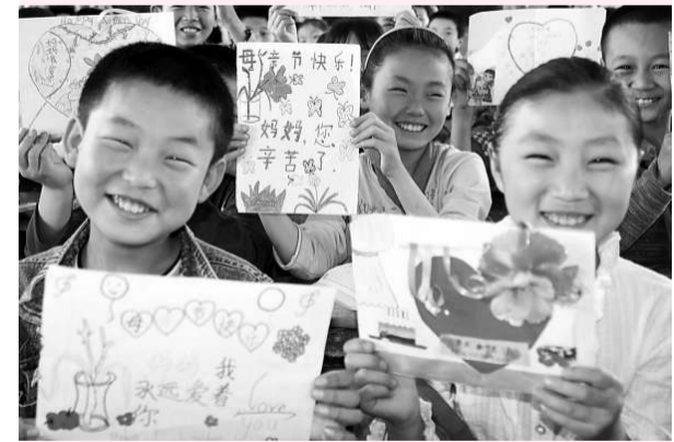
小學生在幸福地展示為母親製作的卡片

【本報記者楚長城、通訊員曹中洋、馬平南陽八日電】5月8日，河南省鄧州市古城幾位小學生展示為母親製作的卡片，表達對母親的愛，迎接母親節到來。