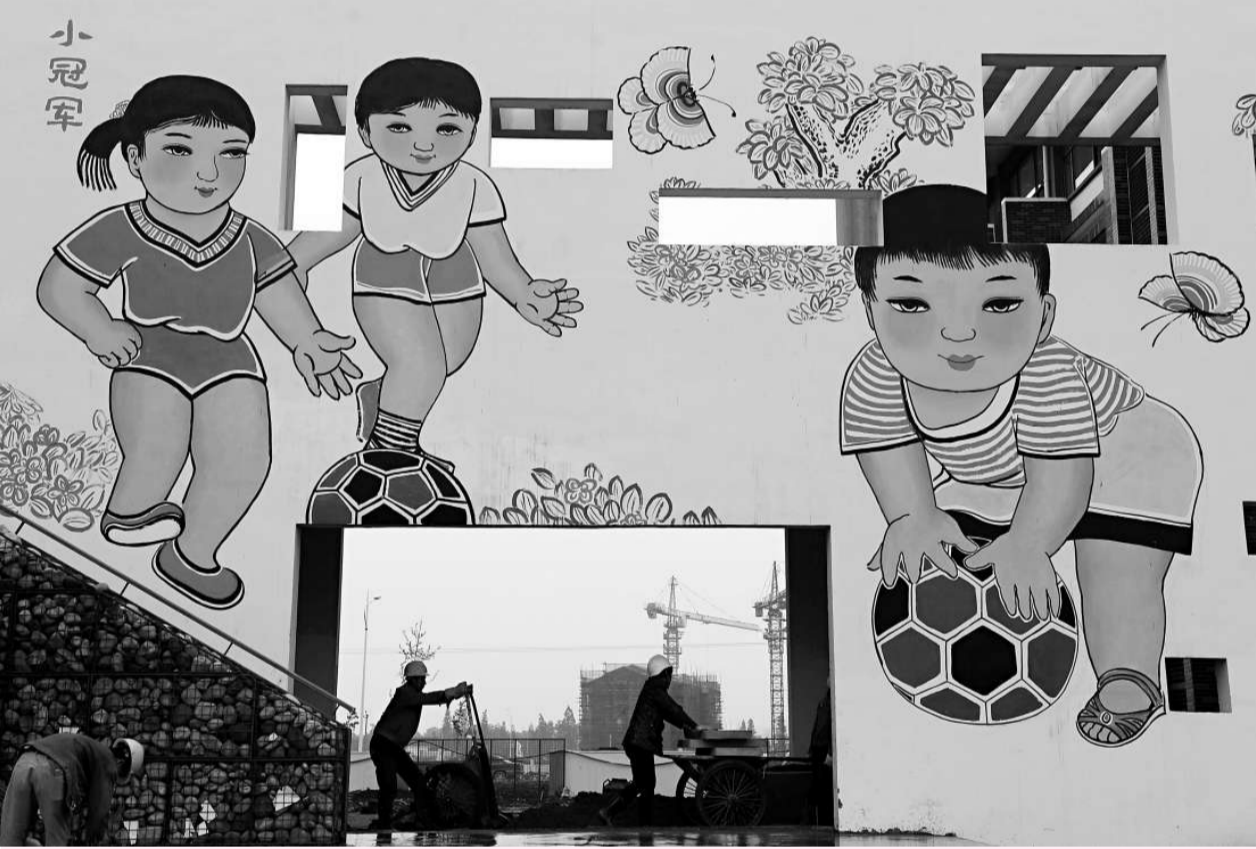
8日，由江蘇省參與援建的四川省綿竹市孝德中學正在進行最後的裝飾工作。目前，江蘇省已安排三批援建項目共219個，援建資金74.8億元，其中已開工117個，竣工49個