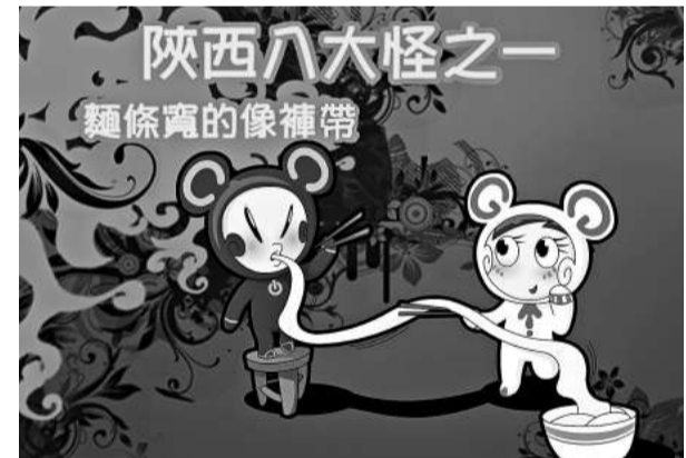
卡通形象生動演繹了「陝西八大怪」

目前，C哥G妹這個卡通形象已經被製作成了插畫和四格漫畫，將通過網絡連載和期刊刊載的方式進行推廣。