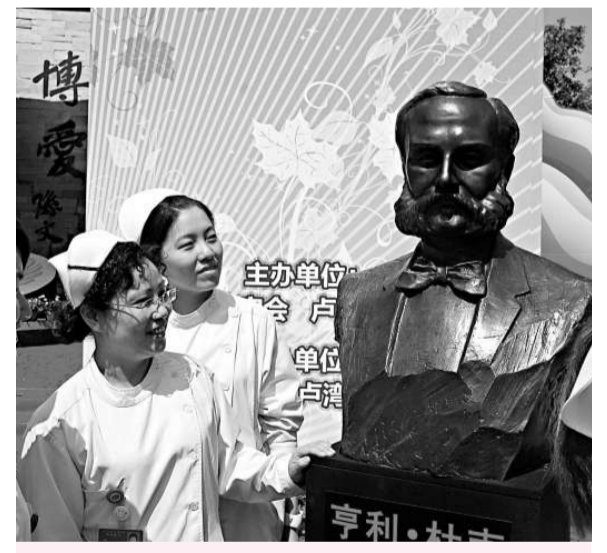
紅十字運動創始人亨利·杜南的銅像落戶上海

另外，為迎接世博，上海市紅十字會今年將分批對全市近一百五十個公園的數百名公園工作人員進行現場初級急救培訓，並將建立公園紅十字服務站。