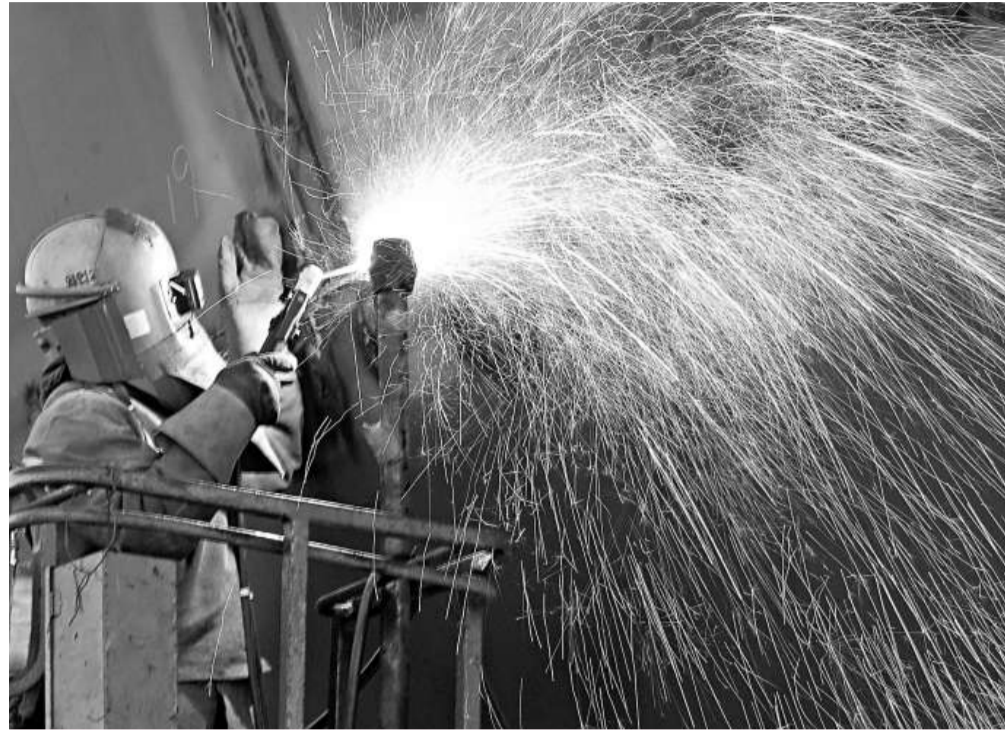
佔載重噸近九成被取消訂單與韓國和中國船企有關，新興船廠成重災區

另外，報告預期，逾千艘船分別在今年和明年被送往拆解，折算運力可達300萬噸。到2011年，拆船量會降至800艘船，運力為200萬噸。DNV亦估計現時約有900艘船正在灣水，當中486艘為集裝箱船，100艘為乾散貨船。