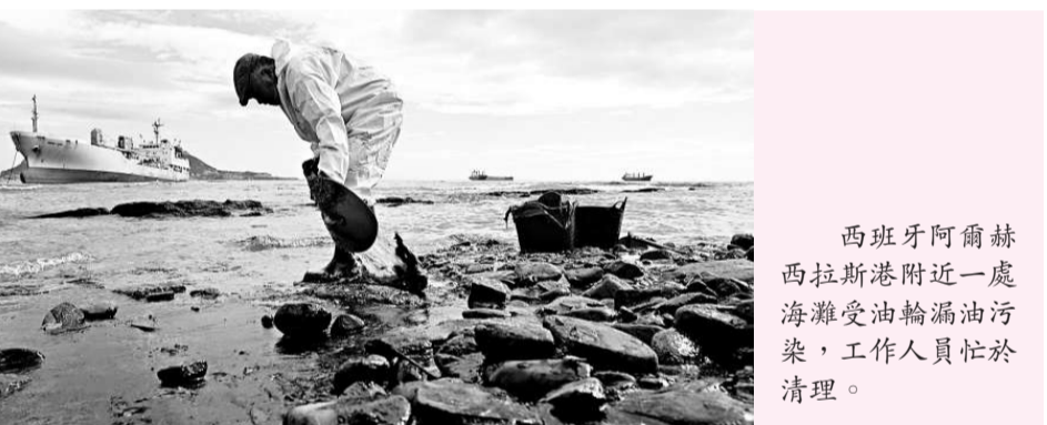
西班牙阿爾赫西拉斯港附近一處海灘受油輪漏油污染，工作人員忙於清理。