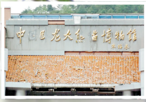
▲朱鎔基題字的中國臥龍大熊貓博物館