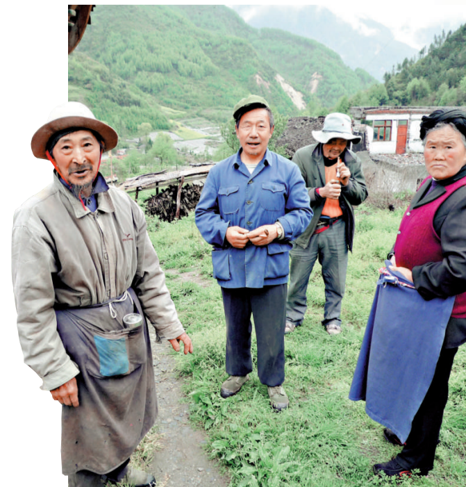
▲神樹坪村民