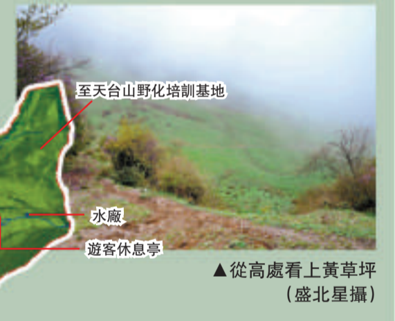
▲從高處看上黃草坪

隨著海拔的升高，植被也起了變化，山上出現了大片熊貓的食糧箭竹林。雨絲飄過，涼風習習。風景越來越美，一片綠海中，不時閃現高山小杜鵑一樹亮麗的紫花。據說，再遲十天半月，滿山的大杜鵑花華麗綻放，「那才是最漂亮的時候」。