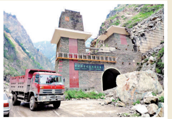
▲303省道臥龍至映秀段

張小平告訴記者，震前臥龍至映秀的公路寬闊平坦，最快20分鐘就可以到達，如今整段公路到處