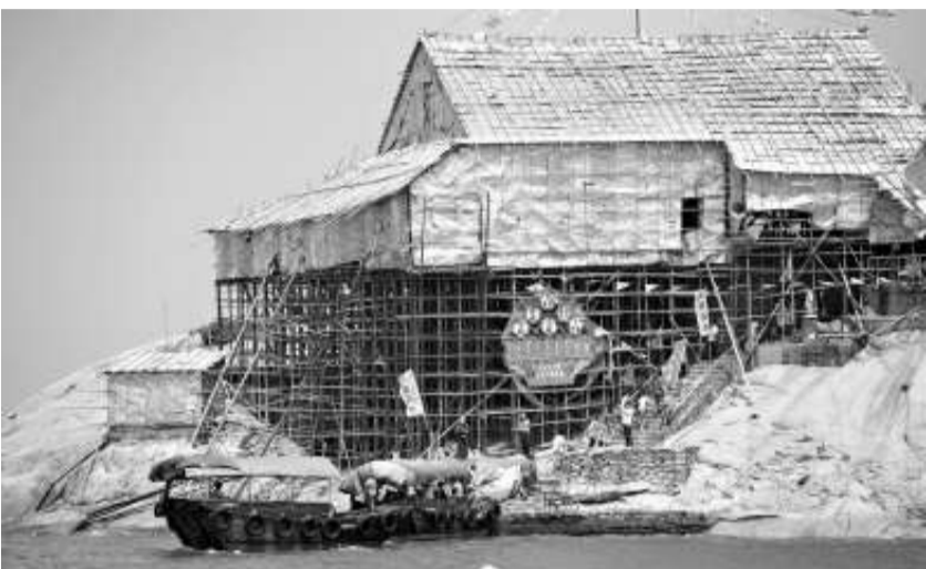
蒲台島天后誕的戲棚建於崖邊上