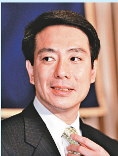
前原誠司 民主黨副代表

現年四十七歲，是民主黨副代表。前原深諳外交關係，主張以強硬的外交手腕處理地區衝突。他曾擔任在野黨影子防衛大臣，曾提出中國威脅論而令中國政府不滿；他對朝鮮的態度亦相當強硬。前原支持修改日本戰後的和平憲法，重新界定自衛隊的角色。