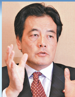
岡田克也 民主黨副代表

五十五歲，因為對抗日本政壇的貪污腐敗而得到「廉潔先生」的稱號。岡田克也也被大部分公眾視為競逐日本領導層的一個可能人選。