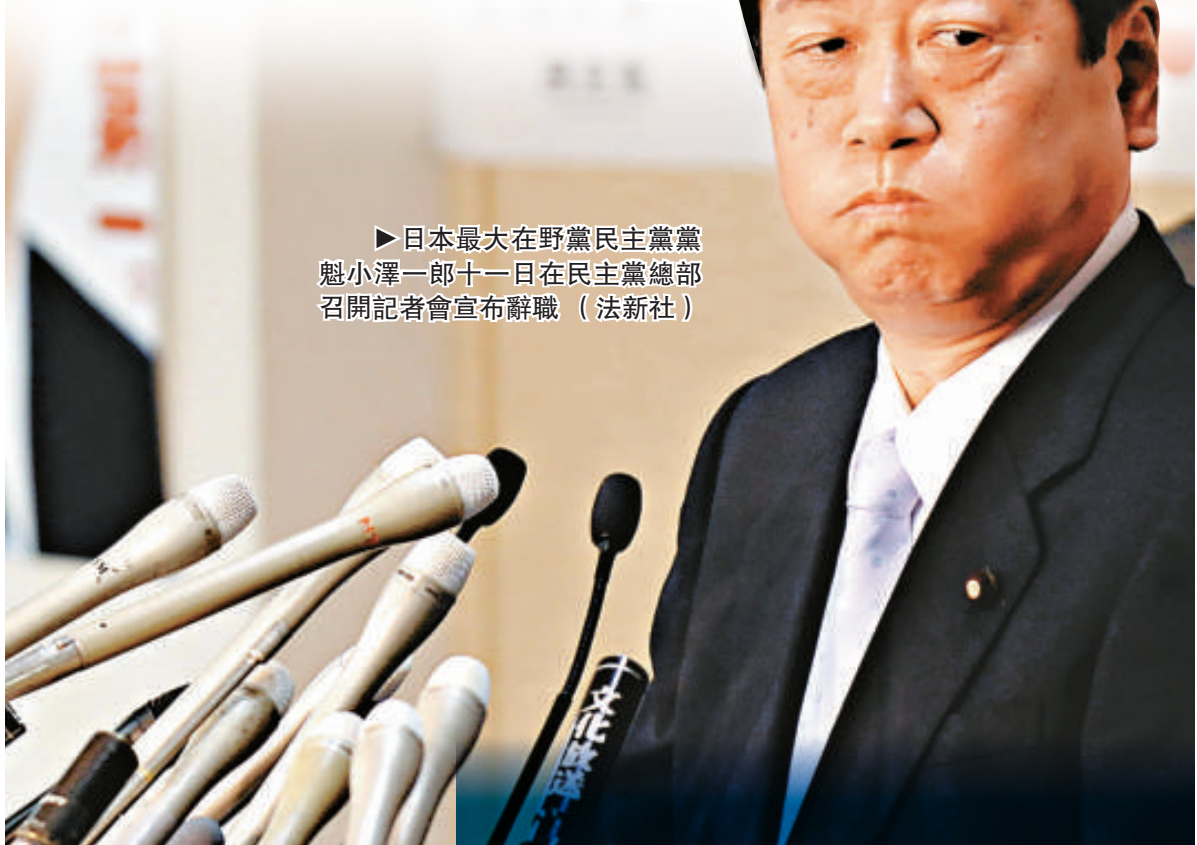
►日本最大在野黨民主黨黨魁小澤一郎十一日在民主黨總部召開記者會宣布辭職

日本前首相中曾根康弘在接受《日本產經新聞》的採訪時指出，小澤在此時辭職是基於對自民黨有利的判斷基礎之上的，對麻生首相來說未必是好事。此舉有博國民同情之嫌，自民黨在選舉時不可掉以輕心。