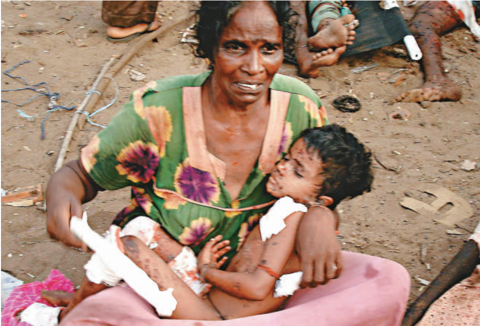
▲大批平民在斯里蘭卡北部的炮火中喪生，其中包括一百名兒童

另美聯社報道，斯里蘭卡政府九日以「錯誤報道該國內戰」為由，逮捕替英國第四電視台工作的一名亞洲記者、製作人與攝影記者，十日再以三人已坦承「做錯事」為由，將他們驅逐出境。遭到驅逐的記者在新加坡接受訪問時，否認他們曾認錯，表示全是斯國「胡說八道」。