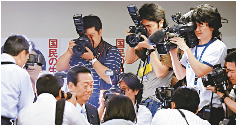
▲中外記者齊聚小澤記者會