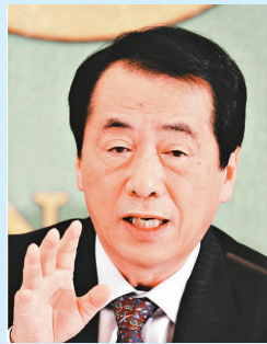
鳩山由紀夫 民主黨幹事長

現年六十二歲，是日本民主黨創辦人之一及前基層組織活躍分子。菅直人曾積極爭取男女平等和消費者權益，亦曾在一九九〇年代出任厚生大臣，處理血液製劑感染愛滋病毒病的醜聞。在一九九六年，他要求下屬公開證據，證明官員在明知有風險的情況下，仍然沒有停止使用感染愛滋病毒的血液製劑，贏得公眾支持。不過，菅氏亦以脾氣暴躁見稱。