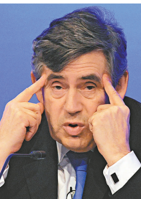
英國首相白高敦就議員騙取補貼醜聞道歉

這些報銷已經影響了公眾對官員的信任，十日發表的一項調查顯示，百分之八十九的受訪者認為議員們的聲譽已經蒙污。