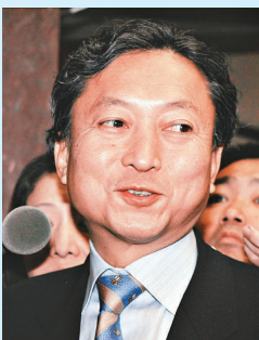
菅直人 民主黨代理代表

現年六十二歲，是日本民主黨創辦人之一及前基層組織活躍分子。菅直人曾積極爭取男女平等和消費者權益，亦曾在一九九〇年代出任厚生大臣，處理血液製劑感染愛滋病毒病的醜聞。在一九九六年，他要求下屬公開證據，證明官員在明知有風險的情況下，仍然沒有停止使用感染愛滋病毒的血液製劑，贏得公眾支持。不過，菅氏亦以脾氣暴躁見稱。