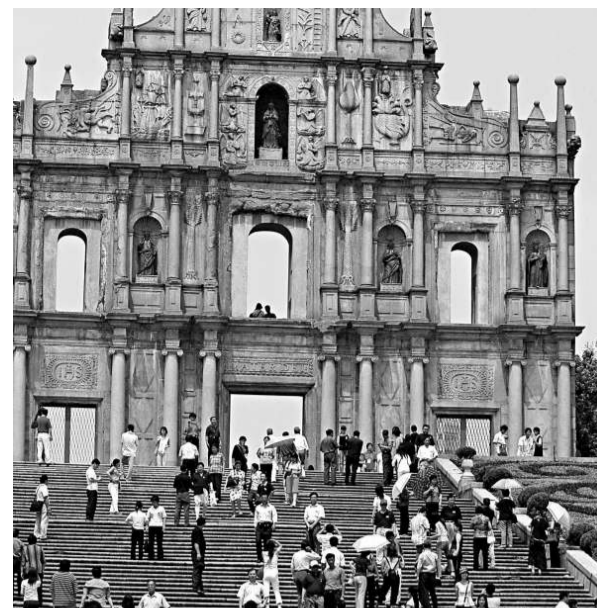
澳門居民今個周五將獲得政府派錢

除公布選舉日期外，何厚鏞還在當天出版的《澳門特別行政區公報》上頒布批示，規定參加第三屆行政長官選舉的每一名候選人的競選活動開支限額為約八百九十四萬澳門元，相當於二〇〇九年特區政府財政預算未修正前的百分之零點零二。