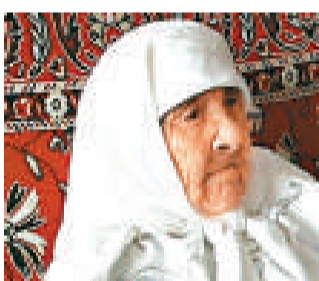
瑞後，連忙恭賀她，並送上新居和其他禮物；卡拉干達市長還親自探望她，向她致敬。

多索娃向官方登記的出生日期為一八七九年三月二十七日，她以前的蘇聯護照和現時的哈薩克斯坦身份證上也有這個出生日期，但直到當局最近進行人口普查，她才廣為人知。地方官員發現她是最老人