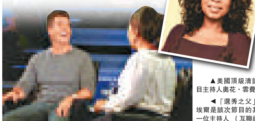
▲美國頂級清談節目主持人奧花·雲費 ▲「選秀之父」考埃爾是該節目的其中一位主持人

她又說，她很享受她作為明星的每一刻。雖然蘇珊大孀已成為世界紅星，但她並不認為自己在《全英一叮》中一定能贏。她說：「我確實很有機會，但同時比賽中有天分的人尚有很多，因此我願意與他們一較高下。」