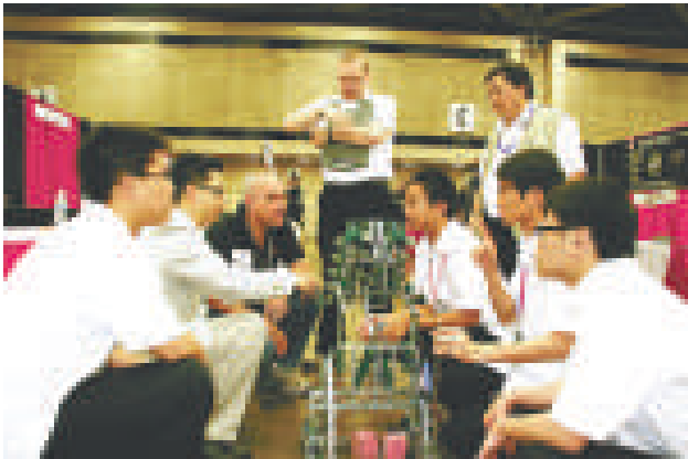
由石龍中學設計的機器人在美國VEX機器人比賽上受到外國朋友的關注

「越時空之旅」海峽兩岸地鐵集體婚禮13日在南京舉行。圖為來自江蘇省內的15對新人登上婚車專列，與其他乘客共同分享幸福時刻