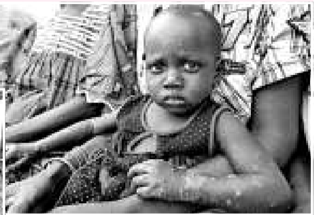
▲當地居民稱，廢物造成數以萬計的人患病，其中包括孩童