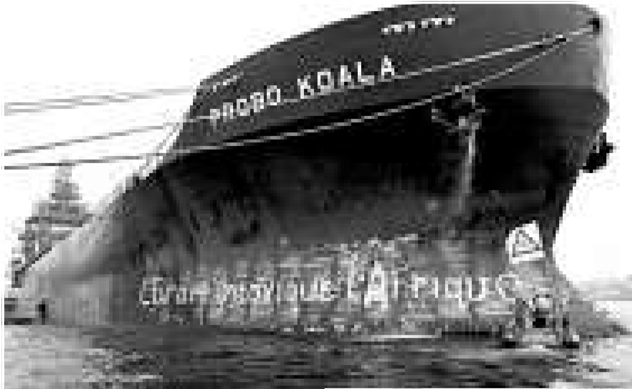
▲將毒垃圾帶到科特迪瓦的 Probo Koala 號貨船

Trafigura 的代表律師十三日聲明，公司無意詳細討論該堆廢料的化學成分，本案的審訊將會對此作出結論。他們又表示，Trafigura 認為有關廢料並沒有像指控所說的那樣導致死亡個案和廣泛疫情，並認為廢料根本不可能導致