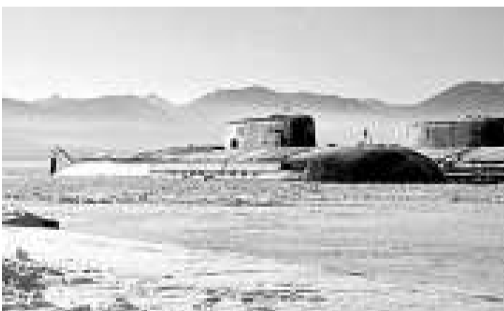
常年冰雪覆蓋的北極水域是俄羅斯戰略核潛艇的天然掩護（資料圖片）

【本報訊】綜合外電報道，俄羅斯政府發出警告，指全球的能源儲備不斷萎縮，而多個國家又互相爭奪蘊藏在北極圈內的天然和石油的控制權。這種情況持續下去，可能會在十年內觸發新的戰爭。