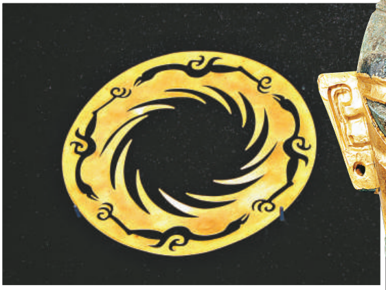
▲太陽鳥金箔（本報攝） ►戴金面罩青銅人頭像