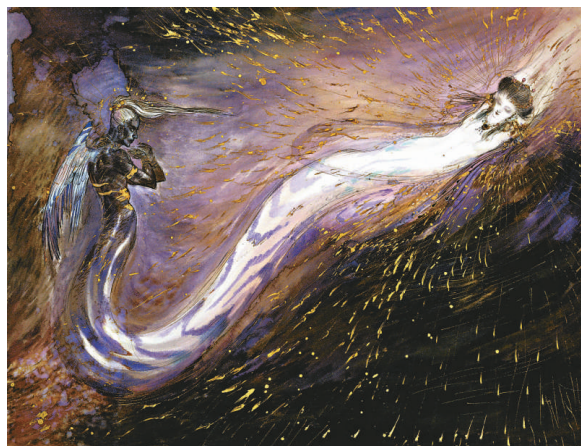
天野喜孝描繪的《白蛇傳》畫面空靈縹緲