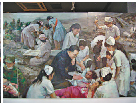
《地動·重生》（節選）重生