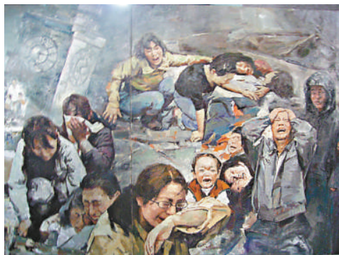
《地動·重生》（節選）災難降臨

汶川的記憶——巨幅史詩油畫《地動·重生》和《5·12表情》展覽將於五月十九日結束。