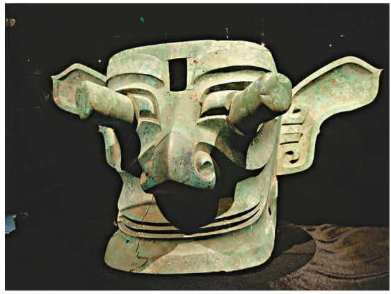
青銅縱目面具