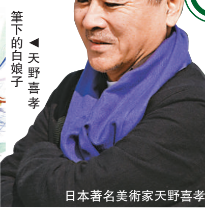
筆下的白娘子 ▲天野喜孝