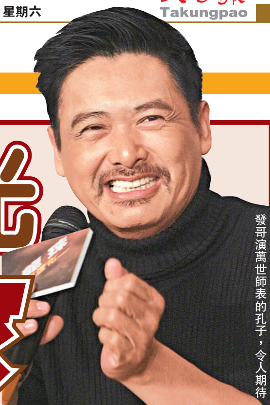
發哥演萬世師表的孔子，令人期待

康城影展剛揭幕就變成中國電影的主戰場。除參賽片備受矚目之外，《十月圍城》、《孔子》等分別設播台零買家。在國內拍攝遮遮掩掩的《孔子》，在康城推出了2分鐘預告片。