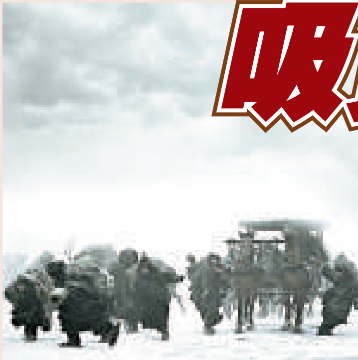
周潤發在《孔子》造型首在康城曝光，成為電影節交易部分最熱門的中國影片