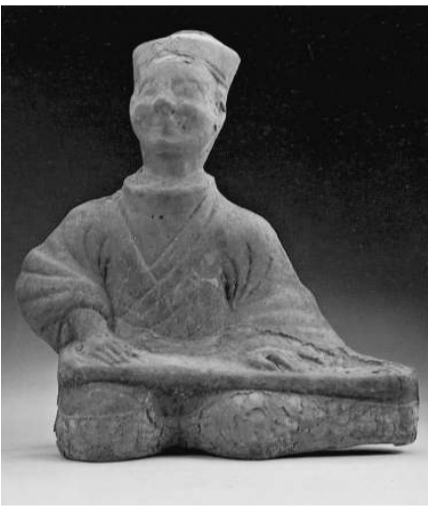
漢代灰陶具原始樸拙風格

漢代灰陶具原始樸拙風格，可說是從新石器時代的土器與彩陶發展到宋、元、明、清瓷器的重要轉折階段。土器即瓦器，不施釉藥，以低溫燒成，吸水性強。陶器乃由陶土燒製成，施以釉藥，用較高溫燒製。戰國時代以黑陶著名；灰陶則盛於漢代。其實，自殷商及兩周，已有灰陶；但兩漢時期的灰陶，比較商、周時質硬和多變化。其灰陶製品除了日常生活用的器皿較多外，灰陶雕塑則朝兩個大方向發展。其一為具神話色彩者，以想像出來的黑獸為多；其二乃趨向寫實風格，尤其是人物和動物(馬、犬、牛、豕、貓、鳥等)。例如附圖的撫琴樂師坐像(高約四十七公分)，乃後漢時期灰陶的代表作之一。人物造型生動，坐姿優美，富有鮮明個性。