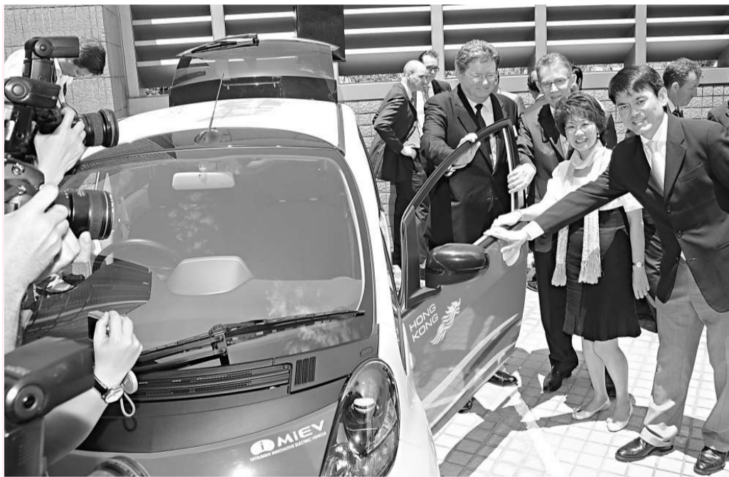
邱騰華(右一)昨日出席電動車充電系統試驗計劃合作備忘錄簽署儀式

【本報訊】記者程度報導：環保電動車有望在未來兩年普及。為配合本港引進電動車，中電未來一年將在九龍區十個停車場試驗為電動車提供充電設施，若反應好未來五年將擴展到其他停車場。專家表示，市民未來有望在自家屋苑為愛車充電，價錢比汽油車便宜九成。