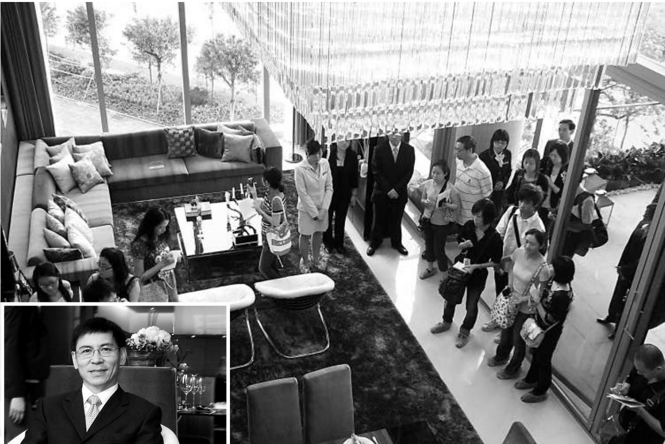
▲花都·凱旋門350平方米殿堂大宅盡顯奢華

鄭正輝還透露，之所以選擇花都建設豪宅高品位社區，主要是花都在珠三角特殊的地理位置和交通上的優勢。「廣州毗鄰香港，香港人到廣州都很方便，不過這次豪宅主要的消費群針對廣州和花都的消費者，不會向香港進行特別推介，因為我們更相信當地的購買力。」鄭正輝最後評價說。