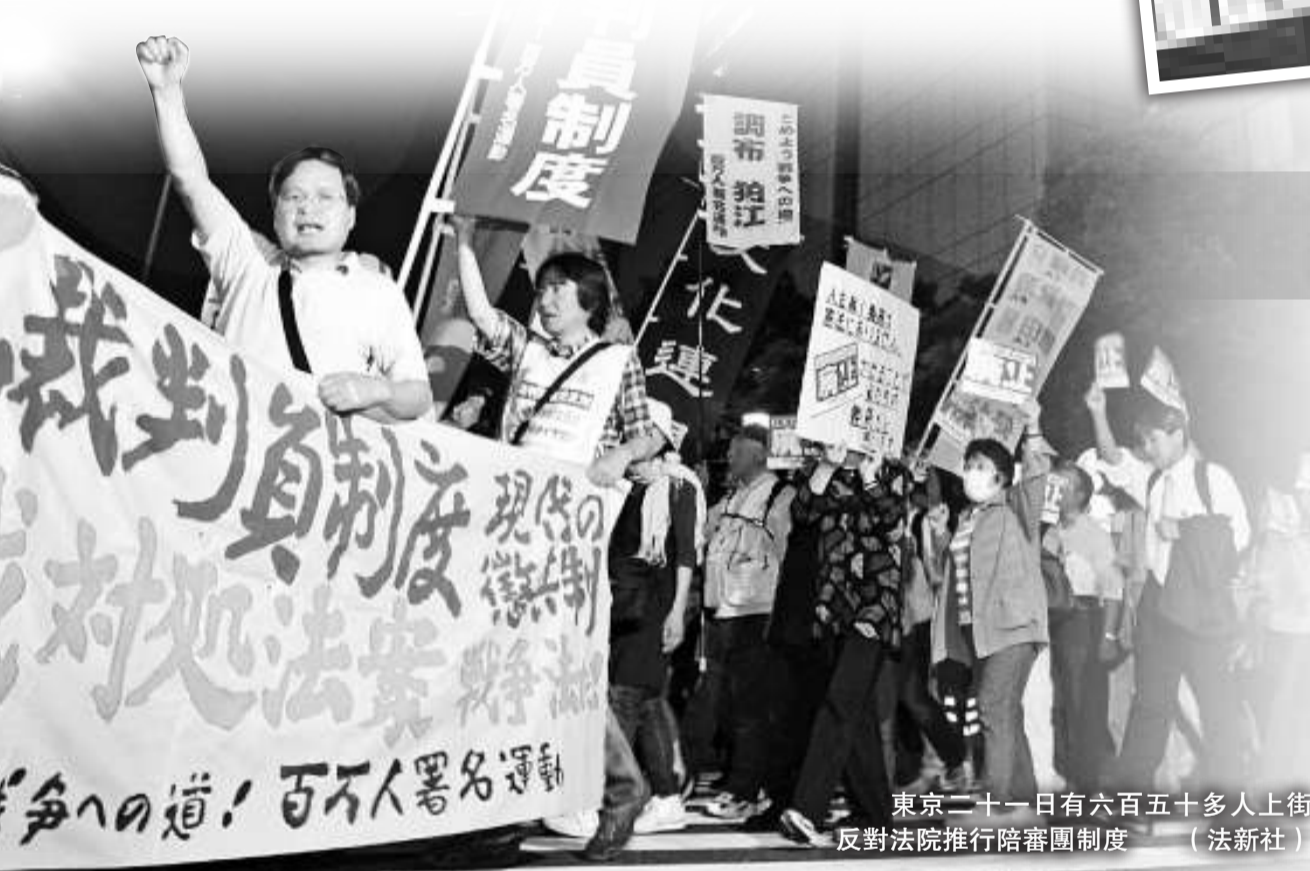
東京二十一日有六百五十多人上街反對法院推行陪審團制度 (法新社)

陪審員在參與審判期間每日可得到一萬日圓（約合港幣八百一十七元）以內的津貼，作爲影響上班等的補償。陪審員具有終生守密的義務，若泄露審理內容，將被處六個月以下的有期徒刑或五十萬日圓以下的罰金，若接到出庭陪審通知而不理會也會被處分。