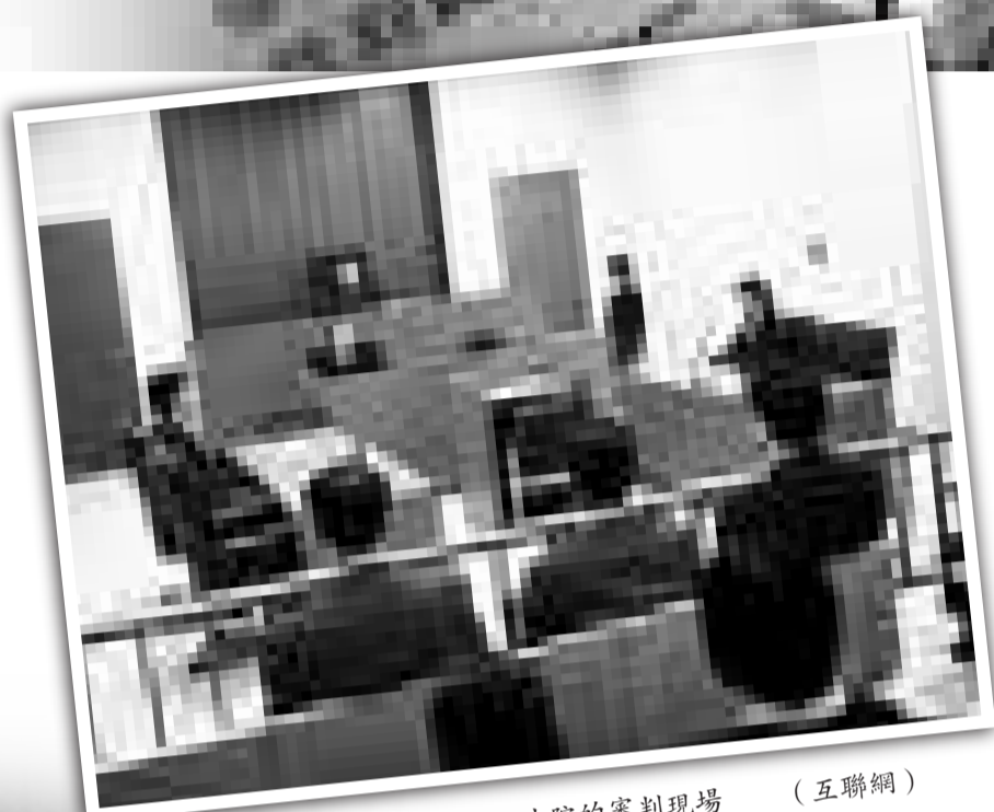
日本地方法院的審判現場

森英介還表示，陪審員對參審活動的感想不負有保密義務，「鼓勵他們向別人積極講述」。