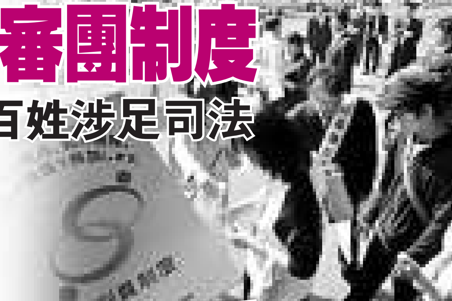
日本街頭宣傳陪審團制度

普通公民陪審或參審的制度在西方國家中非常普遍。在西方八國集團成員中，此前僅日本沒有類似的制度。日本二戰前曾於一九二三年通過陪審法並於一九二八年開始實施陪審制度，但到一九四三年終止。