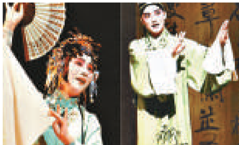
有人認為廣東話中的「冚辦爛」乃源自元曲、雜劇中的「咸不刺」。圖為保留了不元雜劇精髓的昆曲《牡丹亭》

上次談過兩個有趣的廣府話詞語「茄喱啡」及「笏喇蘇」，今次介紹同樣趣味十足的「冚辦爛」，是全部、通通的意思。魯迅《三閑集·在鐘樓上》也曾提到這個廣東俗語，指凡是「外江佬」幾乎無不因為這個詞很特別而牢記。有人認為它是來自英語，事實上英文中有一個洋涇漢詞「hampalang」，中外不少語言學家一直都有專門研究，對其來源爭論不休。