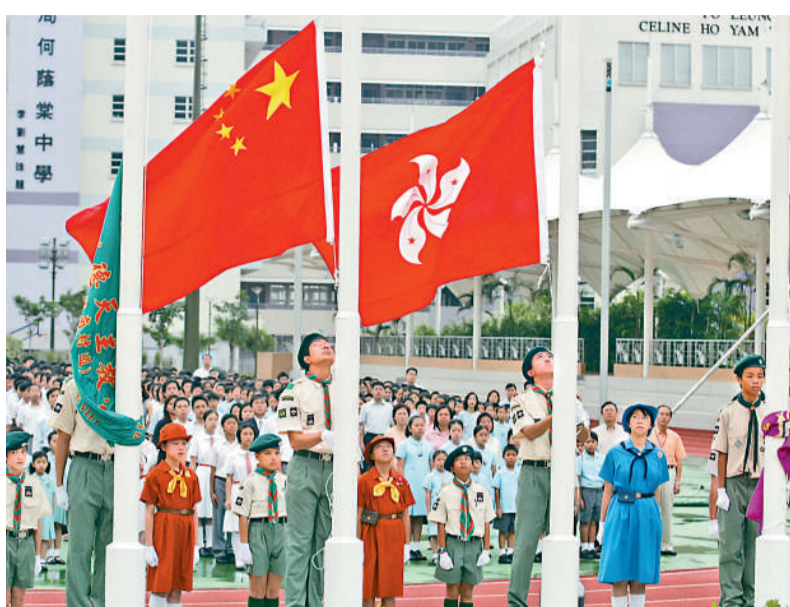
通識中「社會與文化」部分，本港學生較為陌生的是「現代中國」、「全球化」單元，可應用「多元文化比較探究法」來教學、研習