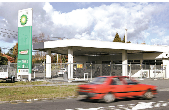
失蹤男女是新西蘭這所油站的東主

【本報訊】據法新社惠靈頓二十二日消息：警方二十二日說，新西蘭一對在其銀行戶口誤收一千萬新西蘭元款項後失蹤的男女，相信身在香港。