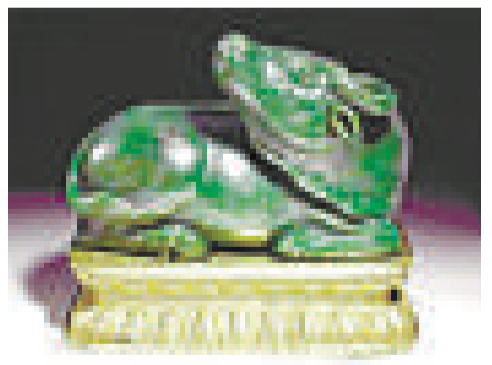
在倫敦拍賣的乾隆玉牛

由於玉牛配有精美的鍍金青銅底座，因此相信是為乾隆皇帝特別雕製。這件玉器雕刻後來流落英國，由身為伯爵的佩勒姆中校以三百鎊(相當於現時的五萬二千鎊)，向倫敦藝術品商斯平克(Spink)購入。