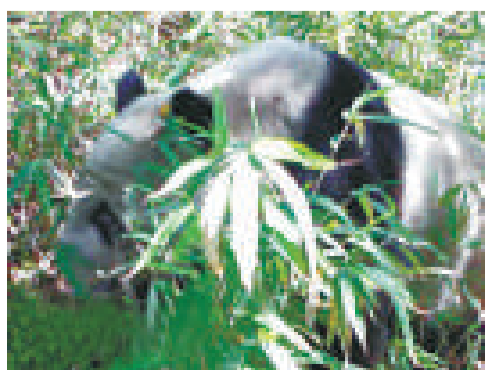
監測隊員現場拍下野生大熊貓的照片

也許是發現有人，這隻不速之客突然停下了下來。十秒鐘後，它從冷箭竹叢中伸出了鼻子。又過幾秒鐘，它又露出了頭部。「啊，是大熊貓！」激動的隊員們連話都說不出來，隊員熊科抄起相機迅速記錄下了這一珍貴的資料。據隊員們介紹，這也是龍溪虹口國家級自然保護區工作人員首次在野外與大熊貓近距離接觸。