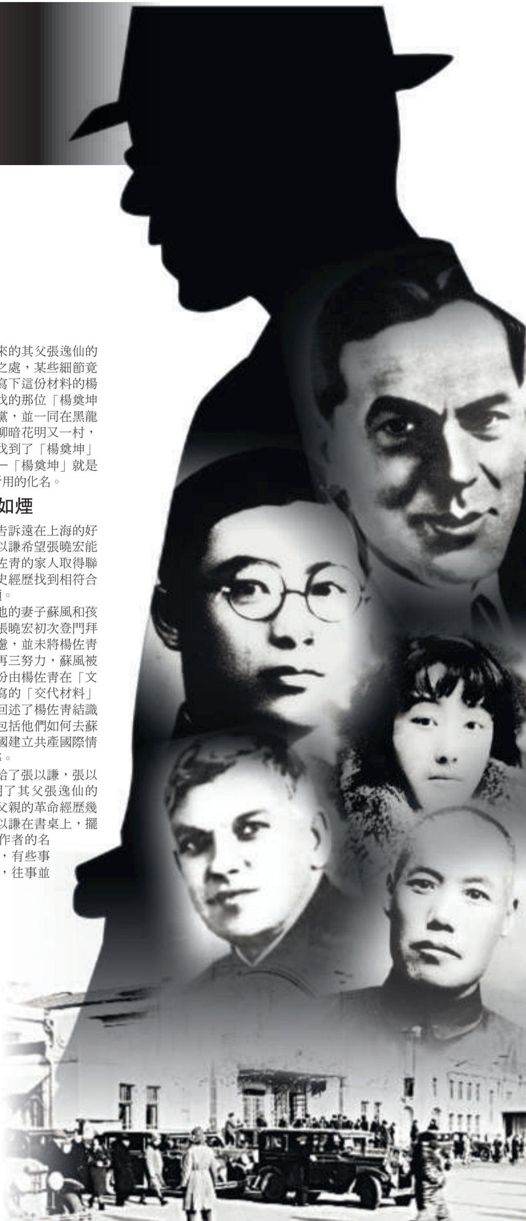
民國時期，日偽統治下的哈爾濱街景 (互聯網)