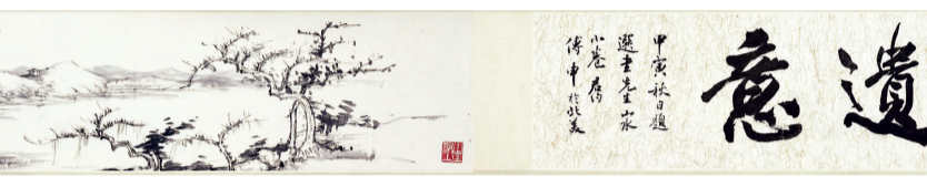
繼公之書畫秉承中國明清以來文人畫的優秀傳統，充滿「士大夫氣」，是當今社會難得的「學者畫」書畫藝術家。 是畫水墨寫真夫山居之景，以文人筆墨揮灑，用筆率真、疏朗，層次

戴進 1388—1462年，字文進，號靜庵，浙江錢塘人，山水宗李郭，馬遠等南宋畫派。死後人始重之，並目為浙派始祖。該卷由近代書畫世家戴進臨先生於上世紀二十年代從日本購藏，藏之深閣秘不示人。於六十年代開始由弟子徐子鶴珍藏，1999年春徐翁有得傳，當永寶之。該卷曾經清代大藏家陳澧收藏，並有潘伯昂、張庚、王季復鑒賞，卷首有當代書畫鑒定具顯權賴先生題百首，墨色凝重，筆力千鈞，而破石遠山則以淡墨皴染，筆勢飛動，可謂讀淡剛柔靜動兼實兼備有之，一改元季淡墨枯寂之文人畫風，上追南宋院體畫勁淋漓之神韻，下啓後世浙派濃厚沉鬱之浙派山水風貌，是其典型的承中興風韻。