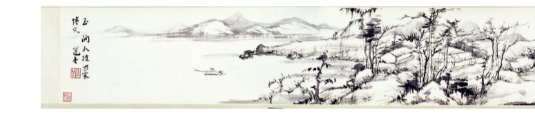
▲陳宗頤 《山居圖》卷 陳宗頤，1917年生，廣東潮州人，著名學者、著作等身，海內外享有高聲譽。 繼公之書畫秉承中國明清以來文人畫的優秀傳統，充滿「士大夫氣」，是當今社會難得的「學者畫」書畫藝術家。 是畫水墨寫真夫山居之景，以文人筆墨揮灑，用筆率真、疏朗，層次