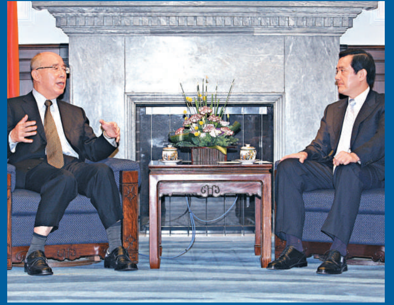
馬英九(右)24日接見吳伯雄，表示國共論壇所討論的問題，最後必須要經海基會、海協會形成法律文件

29日，吳伯雄將轉往杭州，參訪連橫紀念館。31日再趕赴南京，接受南京大學授予的榮譽法學博士學位。6月1日在中山陵出席孫中山先生奉安南京80周年紀念活動。