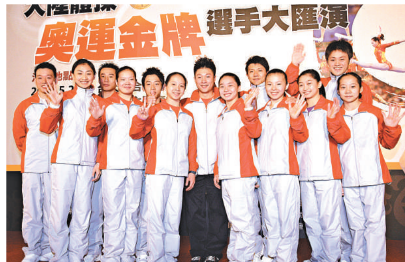
大陸奧運金牌選手訪問團24日抵達台北，將在台北、桃園及苗栗三地進行表演