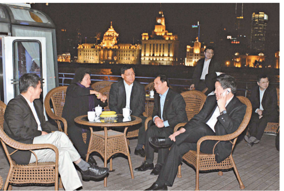
陳菊23日晚乘船觀賞上海黃浦江兩岸夜景

其實，登陸交流對民進黨是百利而無一害。陳菊此行具有四方面的意義：第一，為日後民進黨人士登陸訪問起了示範和鼓勵作用。在陳菊之後，人們紛紛猜測誰是「下一位」？呂秀蓮確實最值得關注，在陳菊登陸前夕，呂說，如今情勢今非昔比，「獨派」應面對現實，不能閉門造車。第二，打破了民進黨下台一年來僵化保守的兩岸政策的束縛，為民進黨掀起兩岸路線的辯論提供了契機。外界推測對於陳菊登陸，民進黨主席蔡英文和黨內高層是達成共識，表示支持的。這可能預示着民進黨的兩岸路線將有一定調整。第三，陳菊將把在大陸的所見所聞帶給民進黨，讓黨內人士進一步了解大陸，以緩和對大陸的敵意。第四，挽回民衆對民進黨的信心和希望。陳菊二十四日結束行程，抵達台灣時，在機場受到支持者熱烈的歡迎，還有人還拉起了「勇敢的台灣菊」的橫幅。