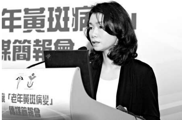
阮燕芬表示，若不及時治理，老年黃斑病變患者視力將會逐漸退化，甚至失明

○一年退休的前警務處處長許淇安去年證實患上肝癌，今月初在瑪麗醫院病逝，終年六十五歲。許淇安是「皇家香港警察」最後一任處長，同時也是香港特區首任警務處處長。一九九七年七月一日，他帶領全港警隊順利過渡。他將扣在警帽上象徵英殖民統治時代的徽章除掉，更換上香港特區政府警隊徽章的歷史時刻，至今仍為港人津津樂道。