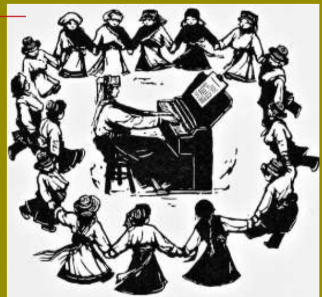
《東方紅太陽昇》 牛文(一九五三年)

以上版畫家的作品是我曾買過或想買的；現在版畫的價格較之5年前上漲了十數倍，雖然說貴了很多，不過投資卻安全了，一個原因是市場認知度高了，另一個原因是資金面打開了。去年名家版畫的均價在一兩萬元左右，這種價位很適合中小規模的資金投入。現在看起來前期的版畫投資者都取得了較高利潤的回報。未來幾年名家版畫的價格將一路走高。原因如下：知名國畫家或油畫家的作品的價格已非常之高，那麼他們的版畫作品的價格也必將被帶高。現在進入版畫市場收藏的機構越來越多，版畫的籌碼越來越少。「油、版、雕」一直號稱是藝術大道上的三駕馬車，油畫市場崛起的西方同時版畫是不會掉隊的。更何況上世紀80年代以前的版畫存世量很少。