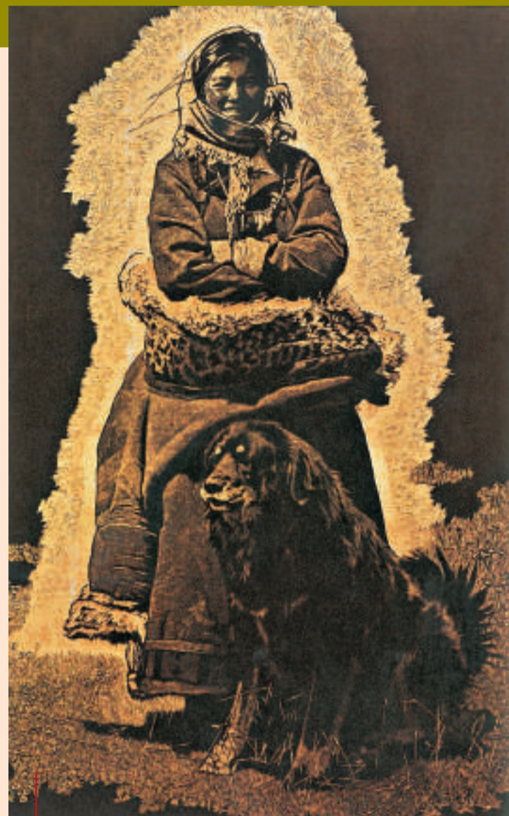
《青藏高原》 徐匡 2007年