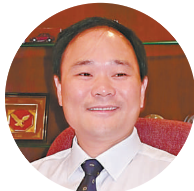
▲吉利汽車主席李書福有信心完成全年汽車銷售目標