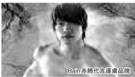
Rain赤膊代言護膚品牌

Rain的廣告大玩神秘mood。韓國傳媒更指，這輯廣告與剛成為另一護膚品牌代言人的裴勇俊，在形象上成強烈對比，認為這次是兩大天王在護膚品市場的大戰。