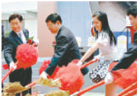
▲張娜拉等主持動土儀式 ► 張娜拉（左）獲委任為上海世博會韓國館形象大使

本月二十五日，張娜拉出席了「上海世博館韓國國家館動土儀式」活動，更被授予形象大使任命書，她也表明，希望能讓世界加深對韓國的了解。另外，她近期積極在韓國曝光，其新片《天空和海洋》將在七月上映。