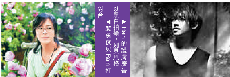
以黑白拍攝，別具風格 Rain的護膚廣告 裴勇俊與Rain打對台