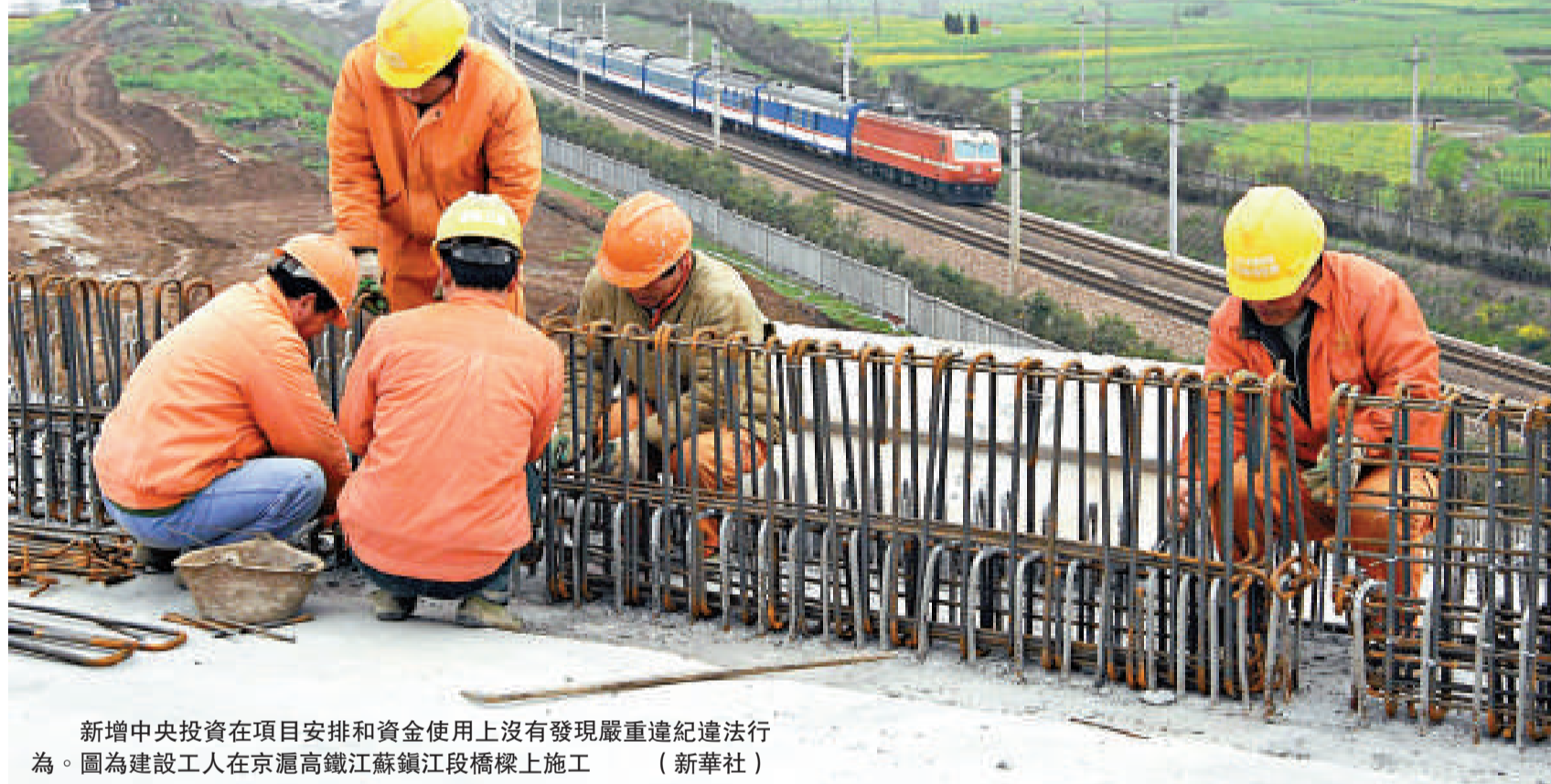
新增中央投資在項目安排和資金使用上沒有發現嚴重違紀違法行為。圖為建設工人在京滬高鐵江蘇鎮江段橋樑上施工

財政部副部長張少春今天在國新辦新聞發布會上表示，2009年中央政府公共投資預算已完成57.1%，總體看各地區部門和單位基本能夠規範合理有效使用財政資金。2009年新增中央投資4875億元，2010年還將新增中央投資5885億元。