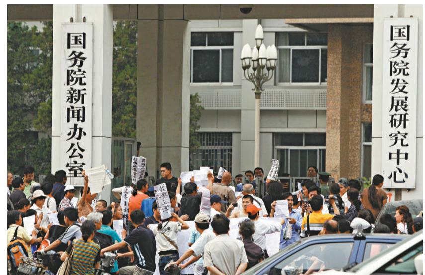
27日下午，國務院新聞辦公室門口，聚集一批外埠上訪民眾，他們打出「上學」、「反貪」等標語。半小時後，民眾被勸離（中新社）