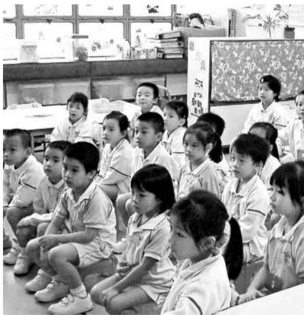
〇七/〇八學年政府實施幼稚園學券計劃，現時全港共八百二十間幼稚園參加學券計劃，約十一萬七千名受惠 (資料圖片)

原意是減輕家長負擔，但通貨膨脹和幼稚園成本不斷上升，加上限定幼稚園學費減免上限五年不變，變相令家長補貼學費金額不斷增加，建議政府調整學費上限及盡快全面檢討。