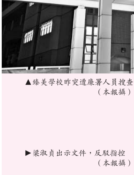
▲臻美學校昨突遭廉署人員搜查 (本報攝)