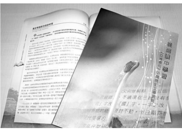
教育局向全港學校派發《亞洲周刊》中國歷史文章選輯

冊子分為「上篇——歷史事件與人物述評」、「下篇——歷史讀物與歷史學者介紹」兩部分。