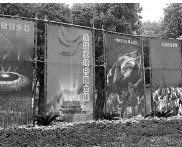
▲「蔡家軍」抵達郴州靜悄悄，除了幾張宣傳畫外，一切從簡 (本報攝)