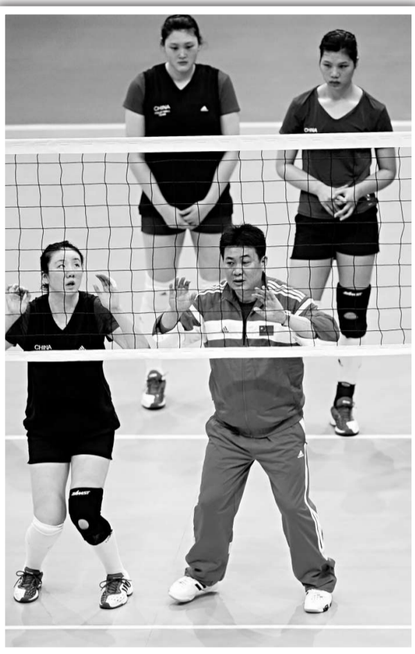
▲中國女排主教練蔡斌(前排右)在訓練中指導隊員