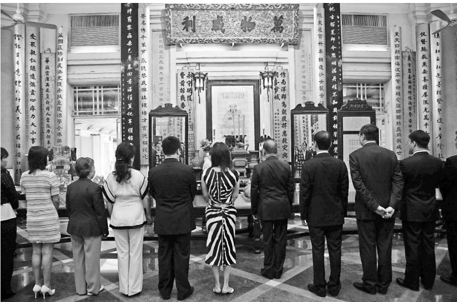
東華三院已丑年董事局成員拜祭神農氏