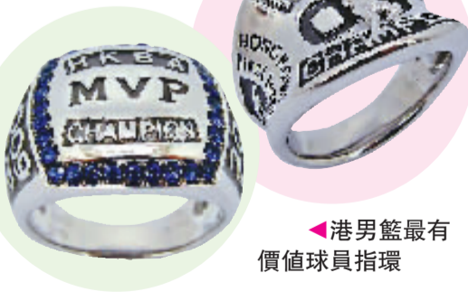
▲港男籃最有價值球員指環

【本報訊】由港籃總主辦之2009年度香港籃球聯賽，今晚假灣仔修頓室內場館進行男子甲一組季後賽首場賽事，頭場晚上7時由永倫戰安青，尾場8時30分由飛鷹鬥南華。票價30元，長者及學生優惠票20元。