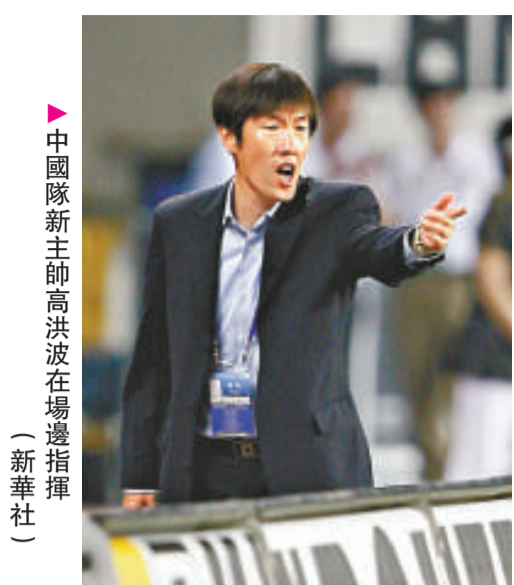
中國隊新主帥高洪波在場邊指揮