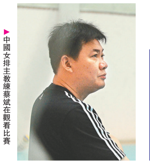
中國女排主教練蔡斌在觀看比賽