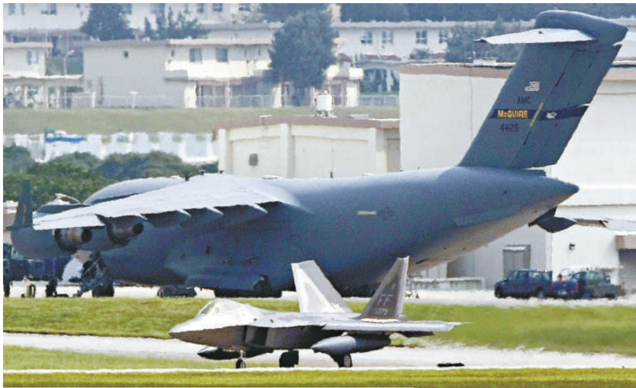
▲美軍戰機由日本沖繩的空軍基地出發，監察朝鮮的動向

面對朝鮮隨時再試射導彈威脅，韓國軍隊在兩韓邊境附近的島嶼加緊演習，提高軍事戒備。而駐守在日本的美軍偵察機亦由沖繩的空軍基地出發，監察朝鮮的動向。