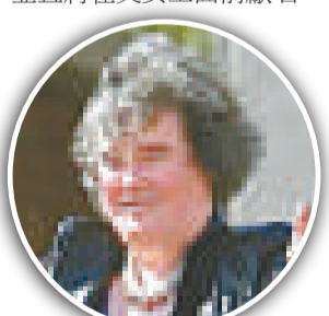
蘇珊大孀能否奪冠即將揭曉

據估計，賽果將於英國星期六晚上九時半（本港星期日凌晨四時半）揭曉。若蘇珊獲得冠軍，將可獲得十萬英鎊獎金，並且將在英女王面前獻唱。