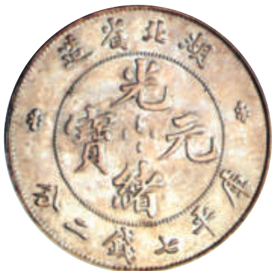
▲▼1896年湖北省造「本省」庫平七錢二分銀幣。

光緒十五年（1889年）四月二十六日，我國第一家機械化的造幣廠——廣東錢局開鑄光緒通寶庫平一錢方孔制錢，開創了我國大規模機械鑄幣的新紀元。