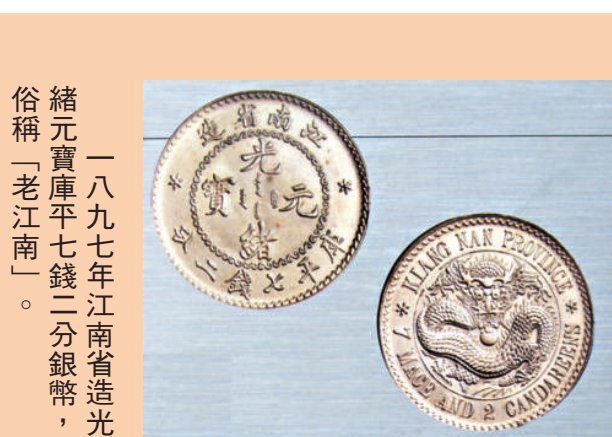
俗稱「老江南」。 緒元寶庫平七錢二分銀幣， 一八九七年江南省造光緒元寶。

光緒十五年（1889年）四月二十六日，我國第一家機械化的造幣廠——廣東錢局開鑄光緒通寶庫平一錢方孔制錢，開創了我國大規模機械鑄幣的新紀元。