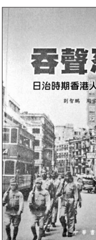
書名：《吞聲忍語——日治時期香港人的集體回憶》 作者：劉智鵬、周家建 出版：中華書局 日期：二〇〇九年五月

《吞聲忍語》講述了許多在「三年零八個月」中發生的事。除了描述了香港當時的面貌外，還訪問了不少曾目睹戰爭的人，讓他們述說過去的戰爭場面。