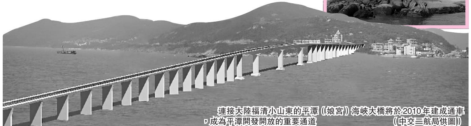
連接大陸福州小山東的平潭(「娘宮」)海峽大橋將於2010年建成通車，成為平潭開發開放的重要通道