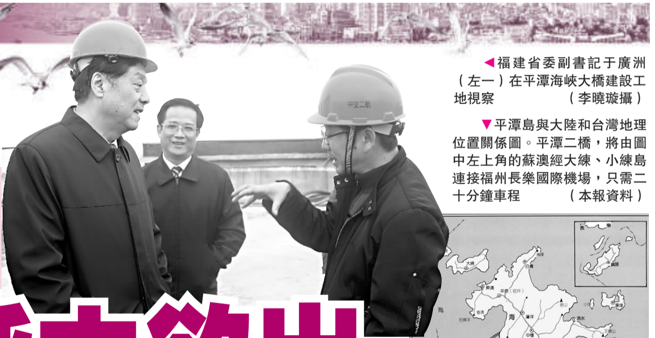
福建省委副書記于廣洲(左一)在平潭海峽大橋建設工地視察

平潭地處台灣海峽突出部，能源開發潛力巨大，曾被國家列為新能源實驗島，島上年平均風速8.4米/秒，是中國風能最佳區之一，