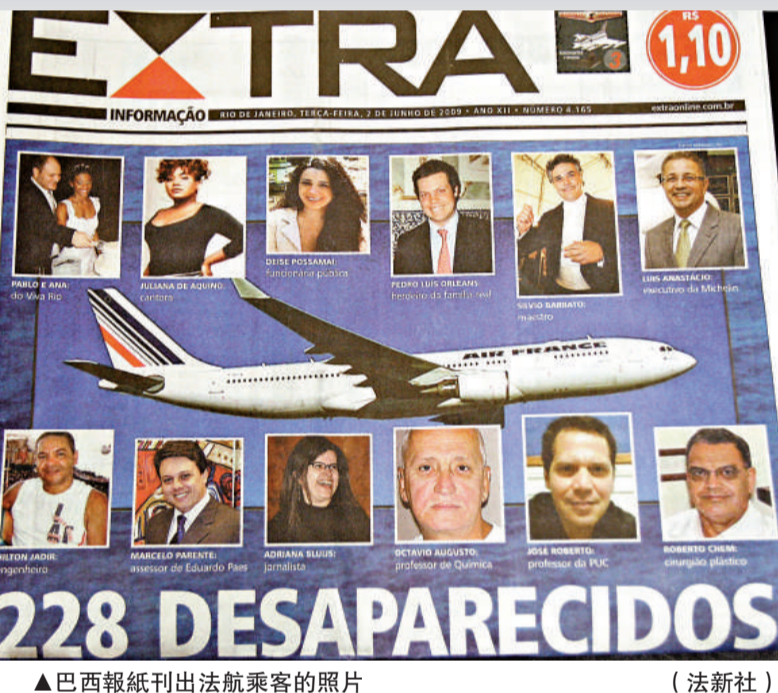
▲巴西報紙刊出法航乘客的照片

從巴西里約熱內盧飛往法國巴黎的AF447航班一日晨在大西洋上空失蹤，從雷達屏幕上消失。飛機上載有二百二十八人，來自三十二個國家，其中機組人員十二人。巴西、法國、美國、西班牙、塞內加爾空軍都派出飛機進行搜救。