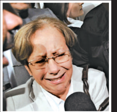
▲失蹤法航客機的乘客親友難掩悲傷