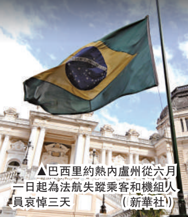
▲巴西里約熱內盧州從六月一日起為法航失蹤乘客和機組人員哀悼三天