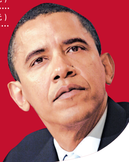
49 奧巴馬 (美國總統) 200 萬美元 (1550 萬港元)