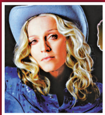
3 麥當娜 (歌星) 1.1 億美元 (8.53 億港元)