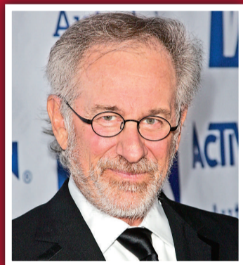
7 史提芬史匹堡 (導演) 1.5 億美元 (11.6 億港元)