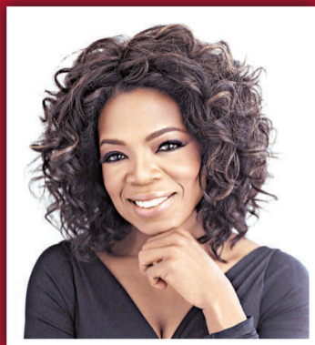
2 奧花雲費 (節目主持) 2.75 億美元 (21.3 億港元)