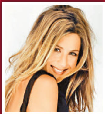
8 珍妮花安妮絲頓 (藝人) 2500 萬美元 (1.94 億港元)