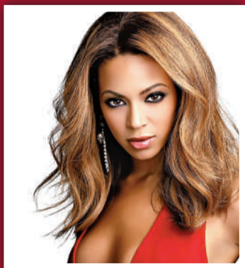
4 碧昂斯 (歌星) 8700 萬美元 (6.74 億港元)