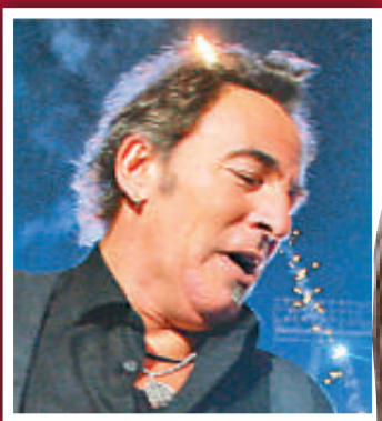
6 普林斯汀 (歌星) 7000 萬美元 (5.43 億港元)