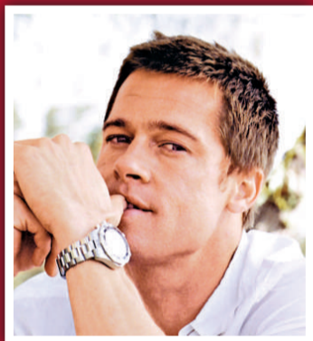
9 畢彼特 (藝人) 2800 萬美元 (2.17 億港元)