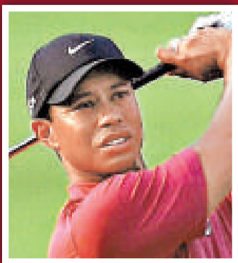
5 老虎活士 (高球手) 1.1 億美元 (8.53 億港元)