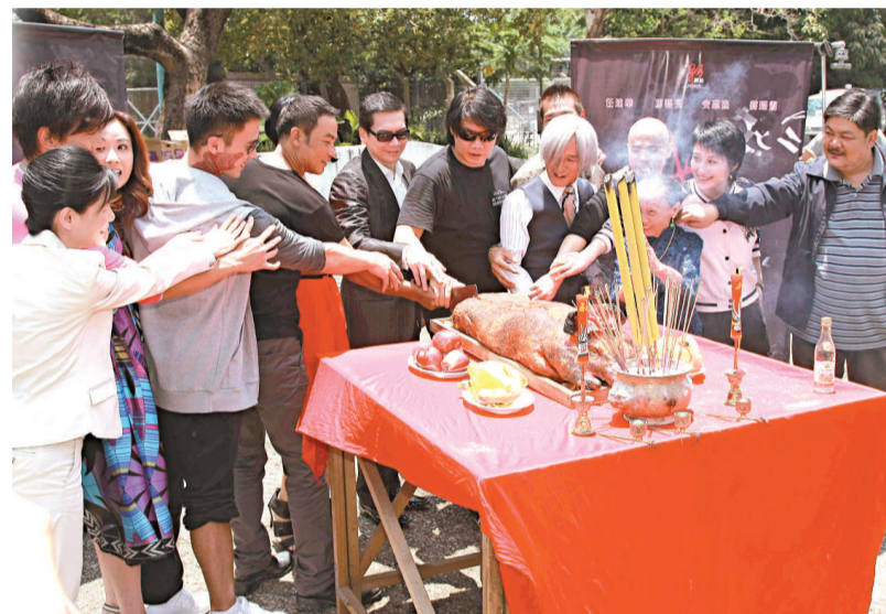
《滅門》台前幕後舉行開鏡拜神儀式