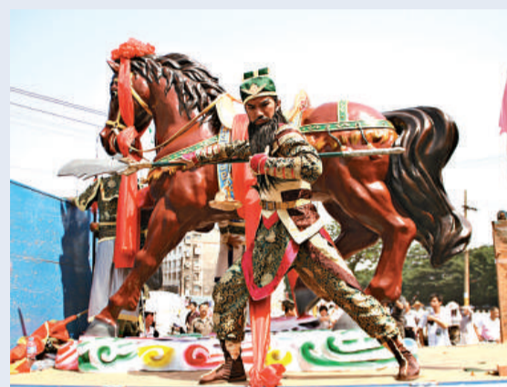
關公在荊州古城內巡遊

【本報記者張萌呼和浩特五日電】「米拉古德」成吉思汗傳統祭祀活動四日在內蒙古呼和浩特蒙古風情園成吉思汗紀念堂舉行。祭祀活動將持續兩天，期間還將有文藝表演、敖包祭祀、傳統馬術表演等活動。「米拉古德」祭祀是成吉思汗祭祀活動中最古老、最崇高的祀典之一，於每年的農曆五月十二舉行。