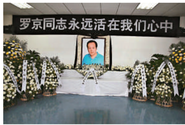
靈堂懸掛「羅京同志永遠活在我們心中」巨大橫幅 (本報攝)