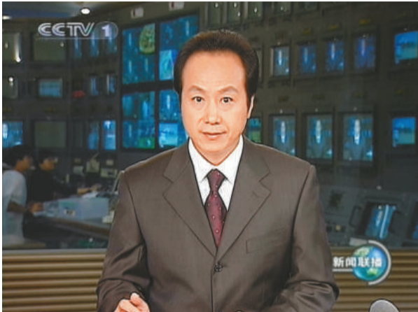
兩年前羅京播報《新聞聯播》