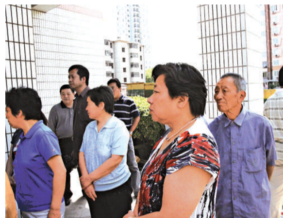
前來悼念羅京的民眾