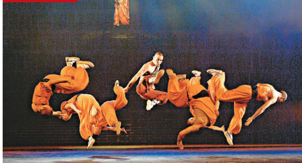
《功夫傳奇》將於7月25日至8月17日，赴英國倫敦大劇院連續演出28個場次，這是中國品牌演藝劇目首次以商演的形式進入西方高端演藝市場。