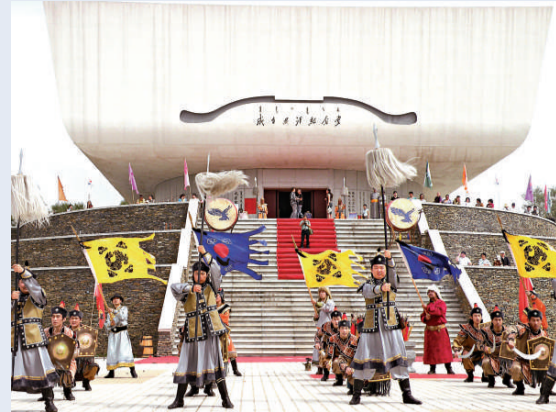
成吉思汗紀念堂外進行表演儀式