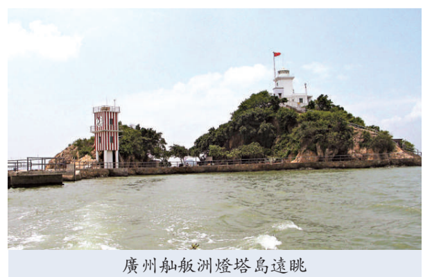
廣州舢舨洲燈塔島遠眺

據秦始皇兵馬俑博物館消息稱，6月13日（本周末）上午，秦俑博物院將對兵馬俑一號坑中間偏北位置的T23方進行發掘，發掘面積200平方米。由於在一號坑已發掘出的秦俑中，均為士兵俑，是次發掘能否在一號坑內發現將軍俑、文官俑成為關注熱點；同時，發掘中憑藉將採用新的文物保護技術，秦俑原本的色彩有望展示在世人面前。