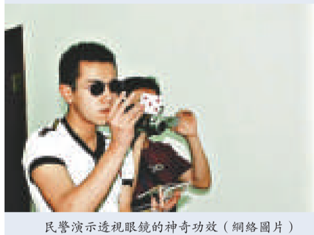
民警演示透視眼鏡的神奇功效

示，由於「貨源渠道好」，福州市場上的這些「貨」已經算是便宜的了，有些人還特地將「產品」寄給遠在廣東的朋友。