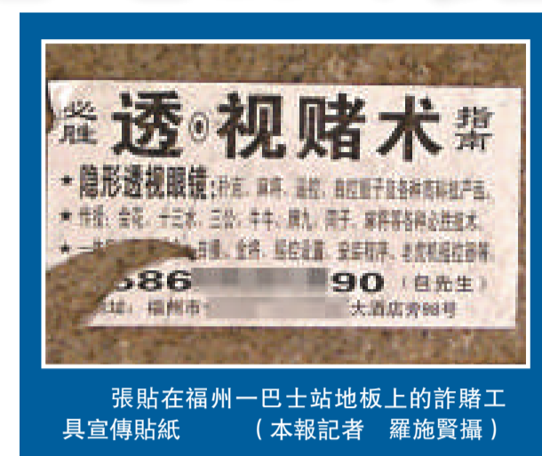
張貼在福州一巴士站地板上的詐賭工具宣傳貼紙

「透視眼鏡」就是會透視麻將或紙牌，它主要是利用光學原理。在牌面上塗抹特殊顏料或藥水，然後戴上「透視眼鏡」，就可以清楚地從背面看到詐賭撲克、麻將正面的花色和點數。還有一種叫做「鏡王」的隱形透視眼鏡，跟市場上的普通隱形眼鏡也很相似。