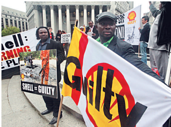
奧貢族人在紐約宣傳蜆殼公司涉及的人權案（資料圖片）

根據美國法律規定，即使發生在美國之外的踐踏人權的刑事犯罪案件也可以在美國起訴，此案於一九九六年被告到美國法庭。