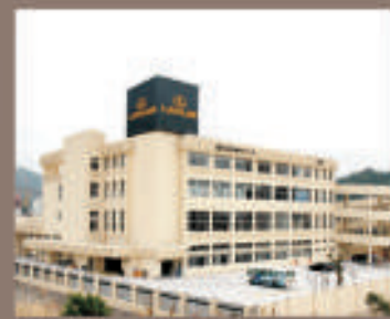
深圳龍華雷克薩斯

惠州龍華雷克薩斯籌辦處 廣東省惠州市河南岸和地路21號（格林豪泰酒店旁） 電話：0752-265 8860 網址：www.hz-lexus.com