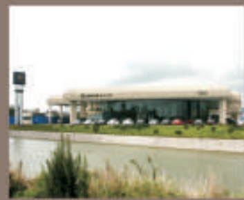
寧波龍華雷克薩斯