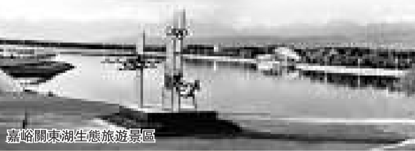
嘉峪關東湖生態旅遊景區