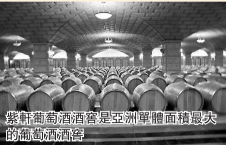
紫軒葡萄酒酒窖是亞洲單體面積最大的葡萄酒酒窖

由酒泉鋼鐵（集團）下屬宏豐實業投資興建的甘肅紫軒酒業有限公司，擁有全國唯一的戈壁葡萄莊園5萬畝，配套全球最先進的以色列肥水灌溉設施，法國壓榨機、德國錯流過濾機、意大利灌裝線及法國橡木桶，其1.37萬平方米的紫軒1號酒窖是目前亞洲單體面積最大的葡萄酒酒窖。